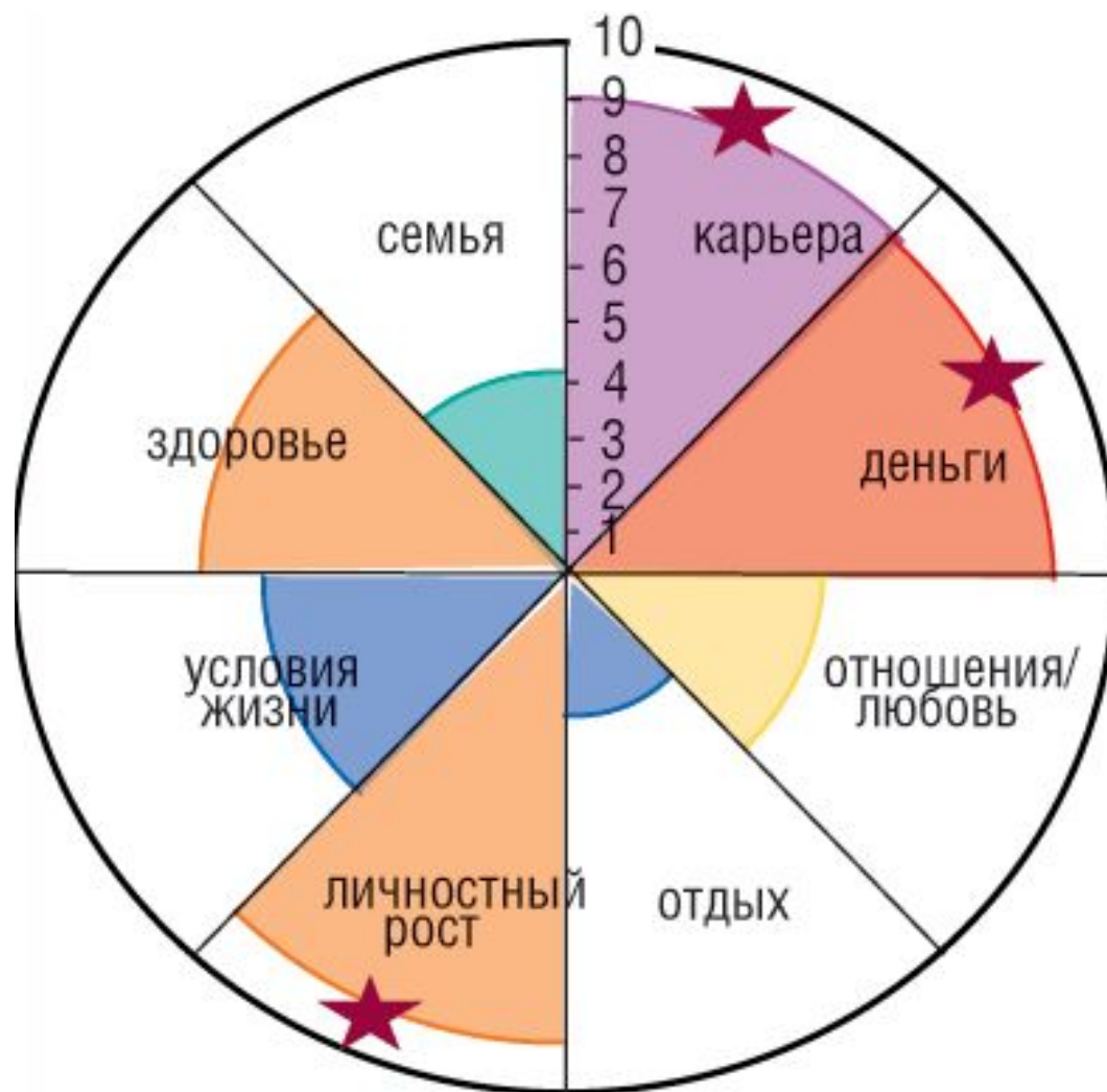
Колесо жизненного баланса