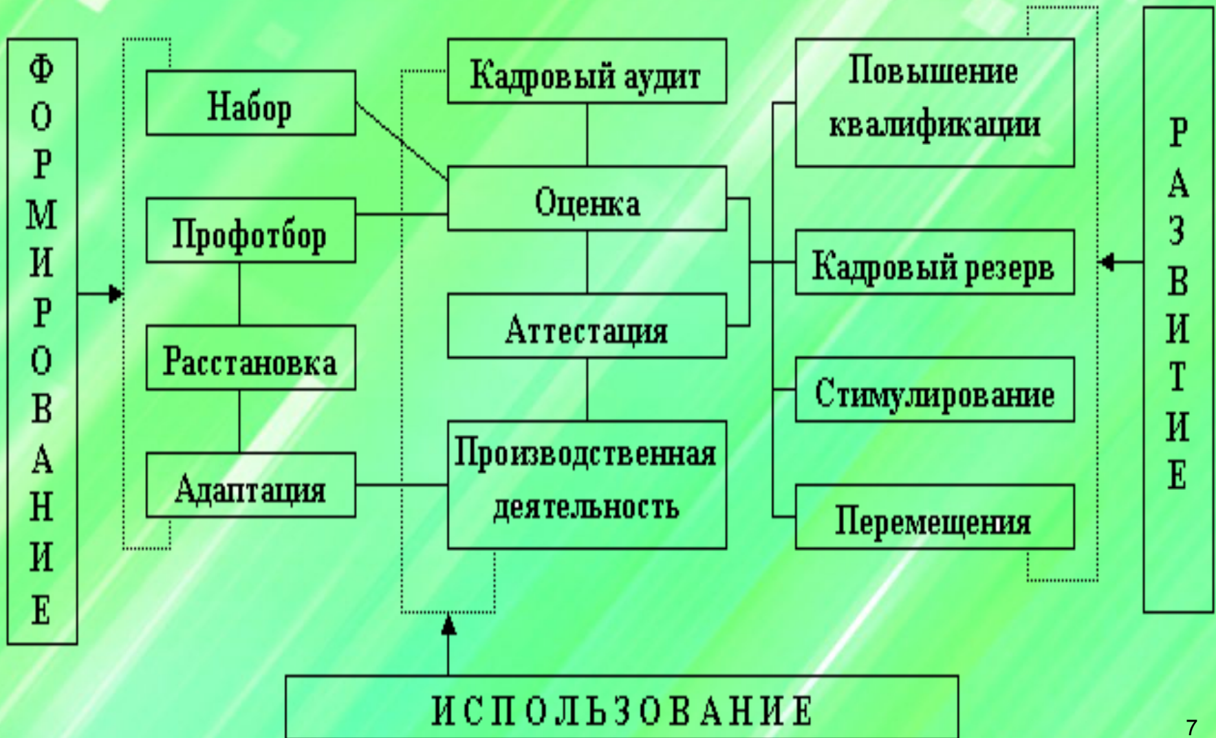
Схема кадровых процессов в организации