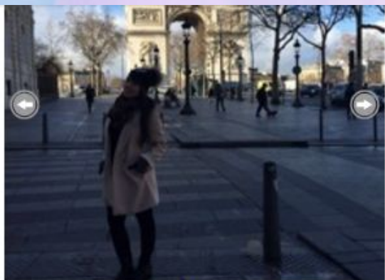
Doing what I love.. traveling