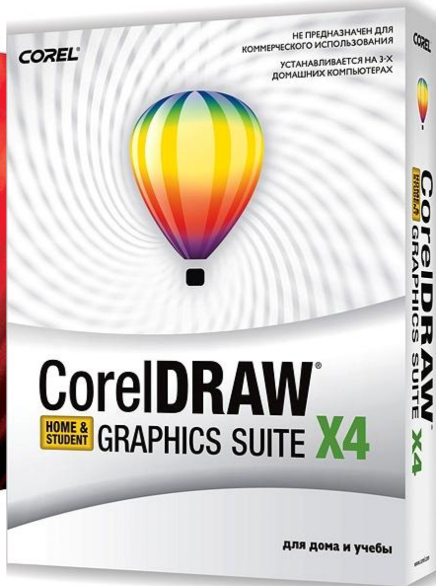
Рис.9. Sound Forge и CorelDraw.