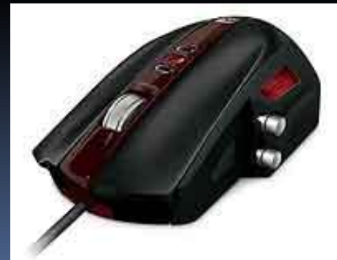
Рис.4. Компьютерная мышь.