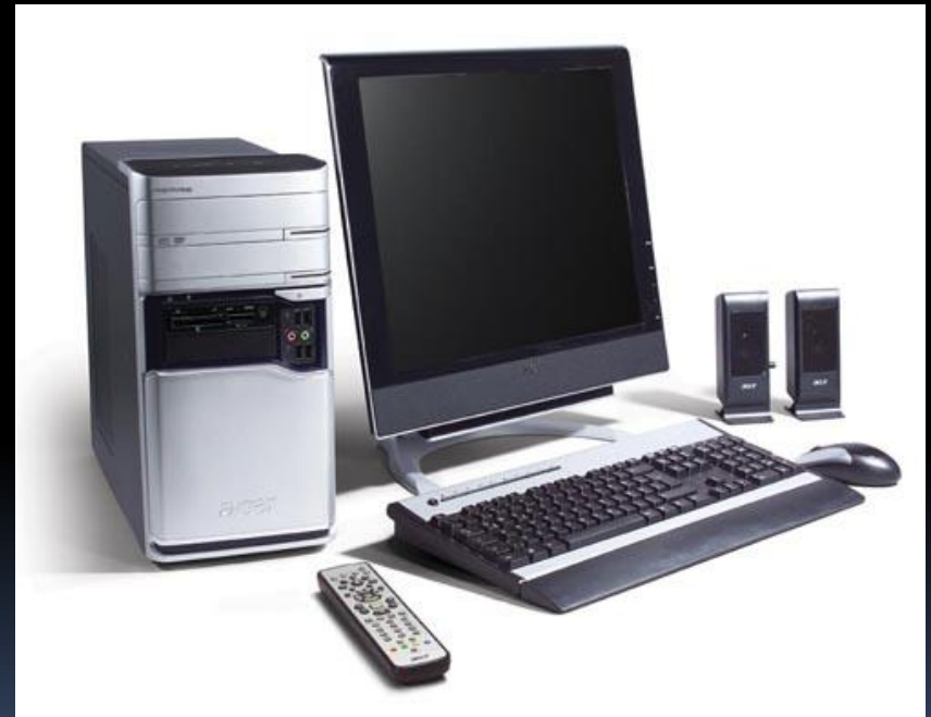
Рис.10. Мультимедийный компьютер.