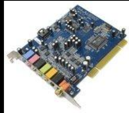
Рис.3. Звуковая карта.