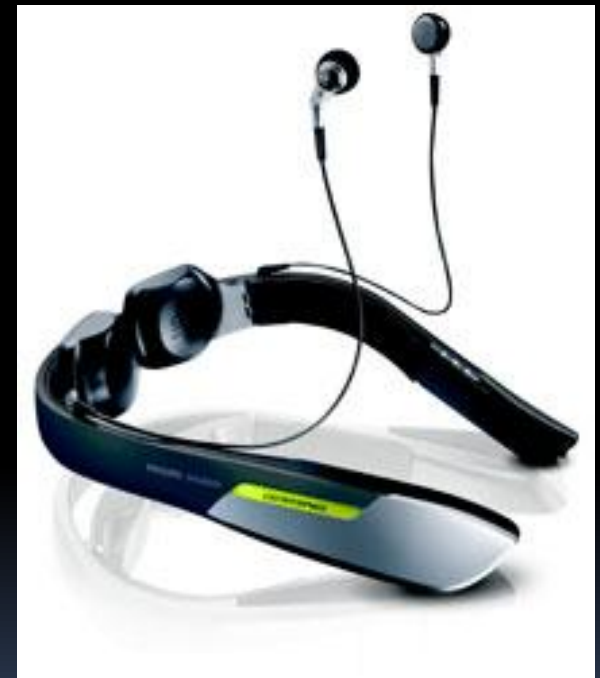
Рис.1. Игровой манипулятор

Слово мультимедиа в буквальном переводе означает много средств для представления информации пользователю. Компьютер без средств мультимедиа сегодня уже не считается полноценным. Многие относятся к этим средствам чуть ли не как к возможности превратить свою жизнь в сказку. Это, пожалуй, преувеличение, хотя иногда и оправданное. Термин мультимедиа используют для характеристики компьютерных систем, графической, звуковой, видео и иной информации. Существенно, что этот синтез и обработку информации сегодня удаётся выполнять практически в реальном времени, то есть без ощутимой пользователем задержки во времени.