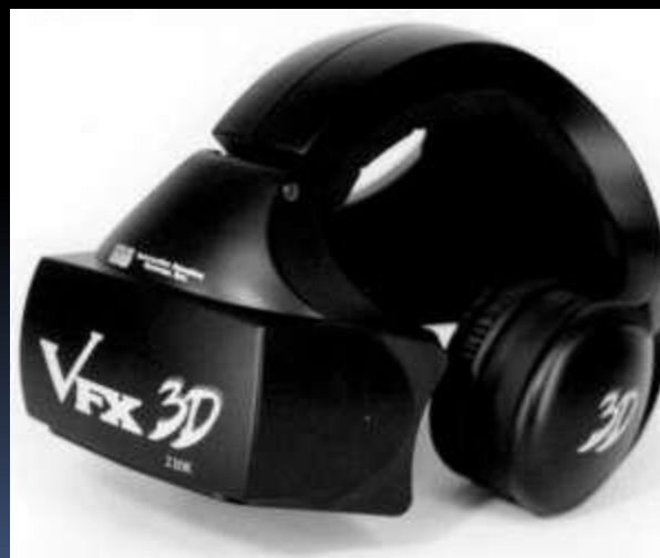
Рис.7.Шлем виртуальной реальности.