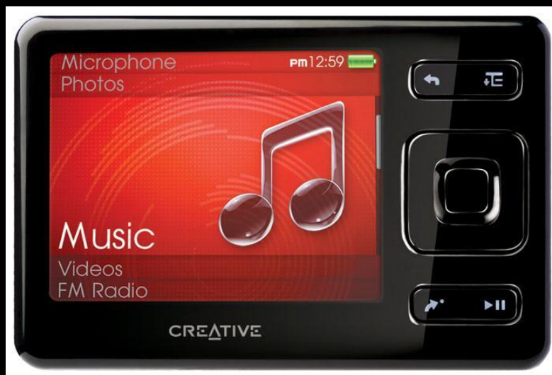
Рис.5. MPEG - плеер.