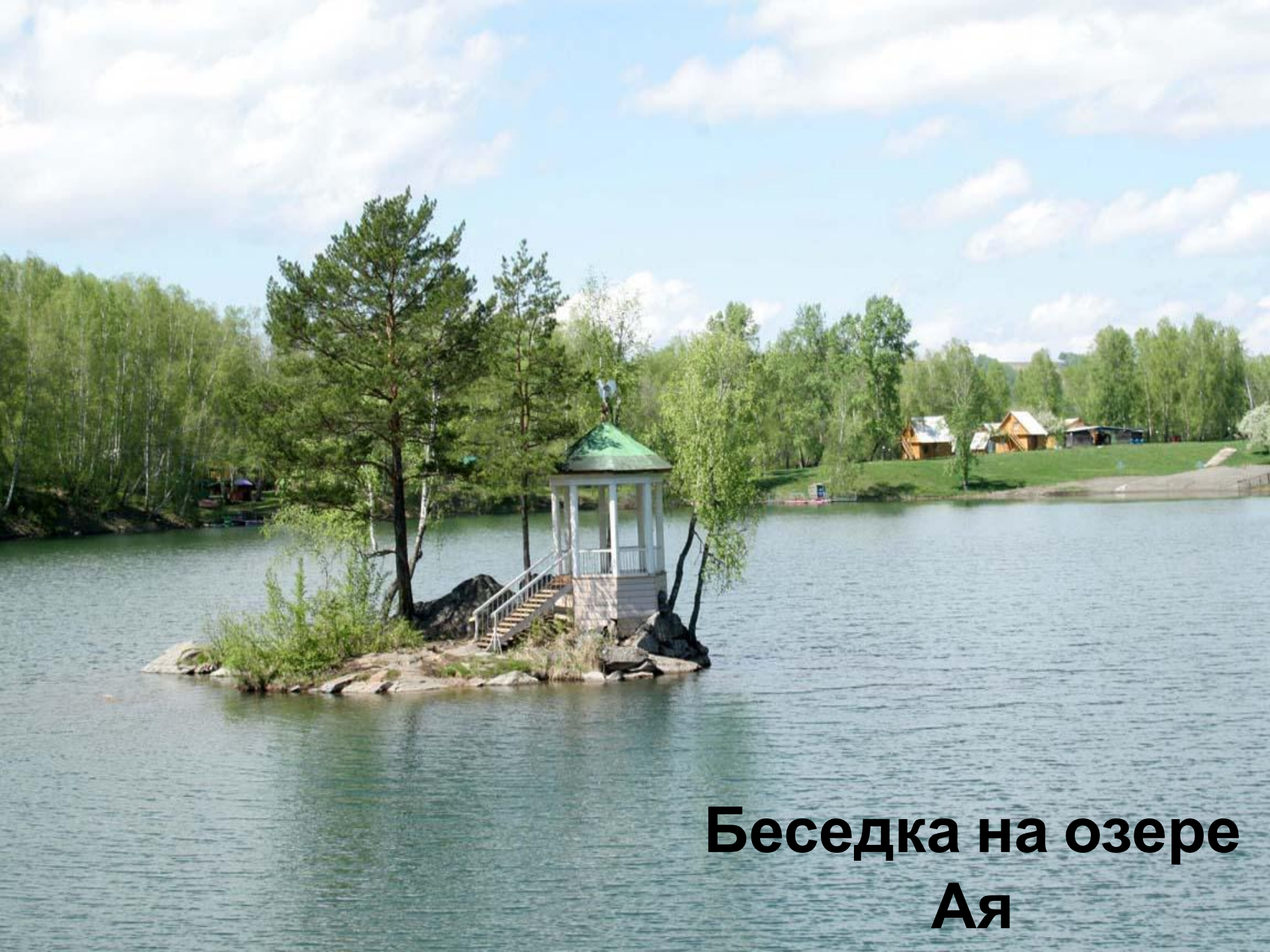
Беседка на озере Ая