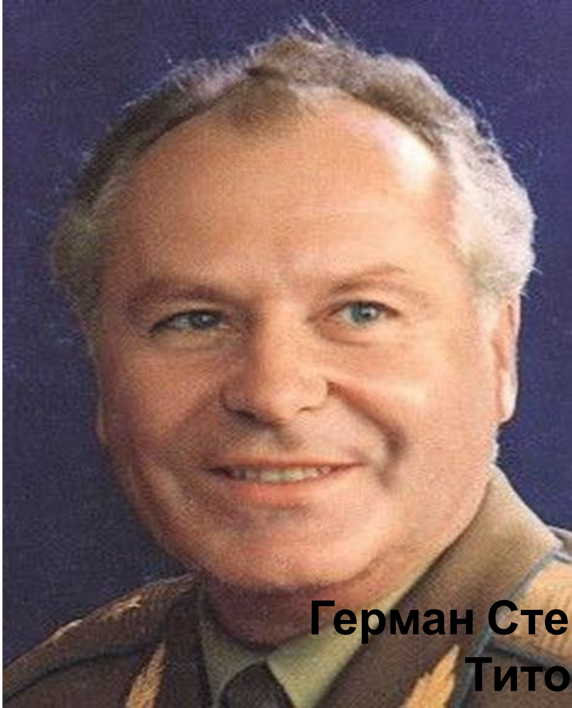
Герман Степанович Титов