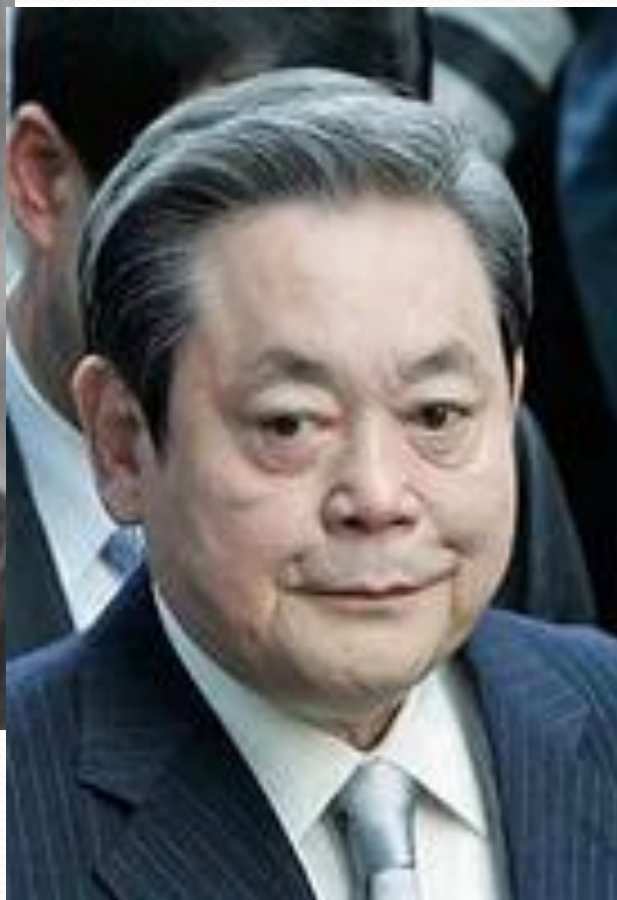
Ли Гон Хи