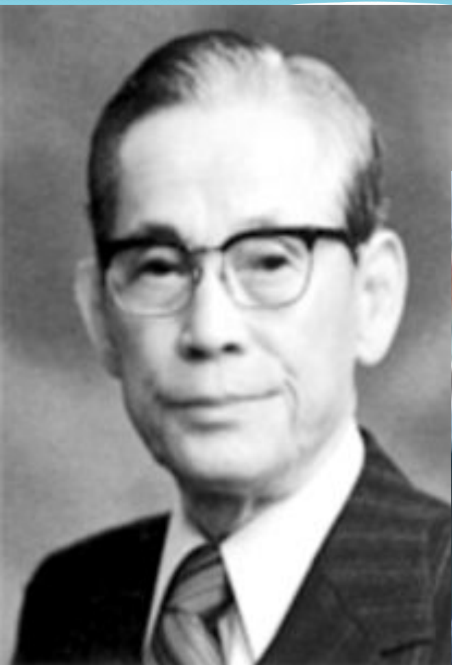
Ли Бён Чхоль