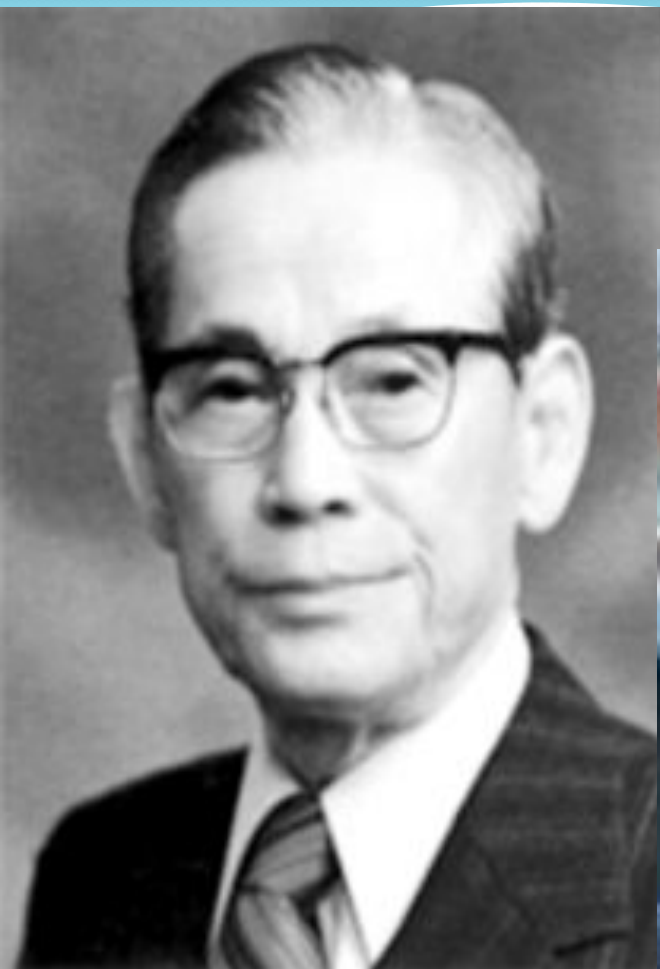
Ли Бён Чхоль