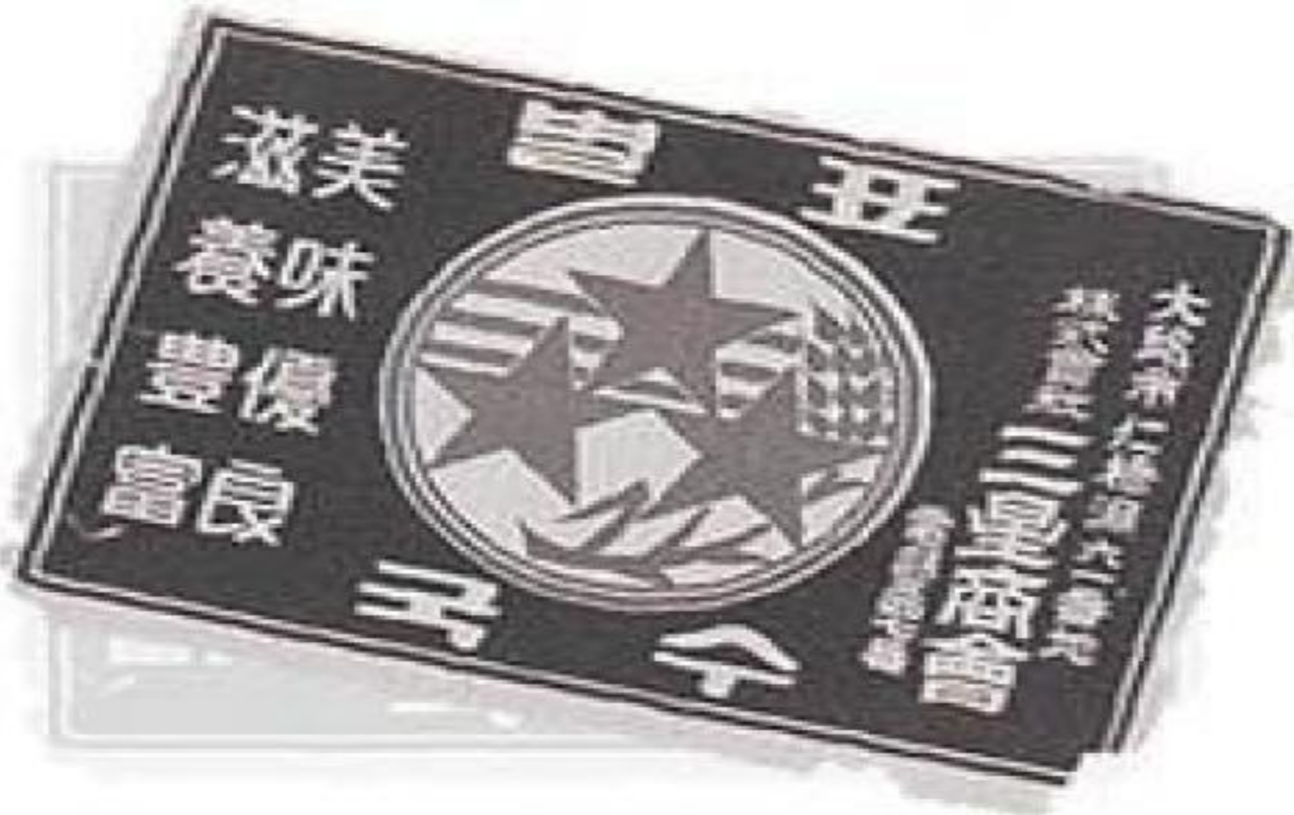
Логотип компании Samsung Byeolpyo, производившей макаронные изделия (1938-1958)