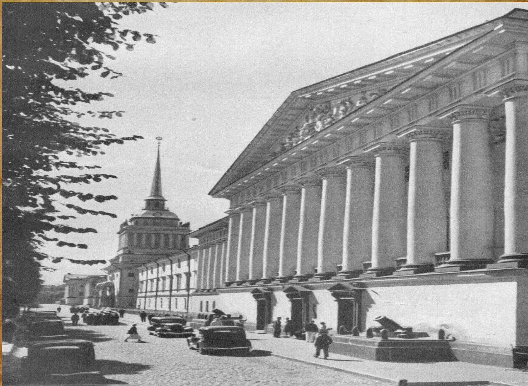
ГЛАВНЫЙ ФАСАД ЗДАНИЯ АДМИРАЛТЕЙСТВА. Архитектор А. Захаров (1806—1815 гг.)