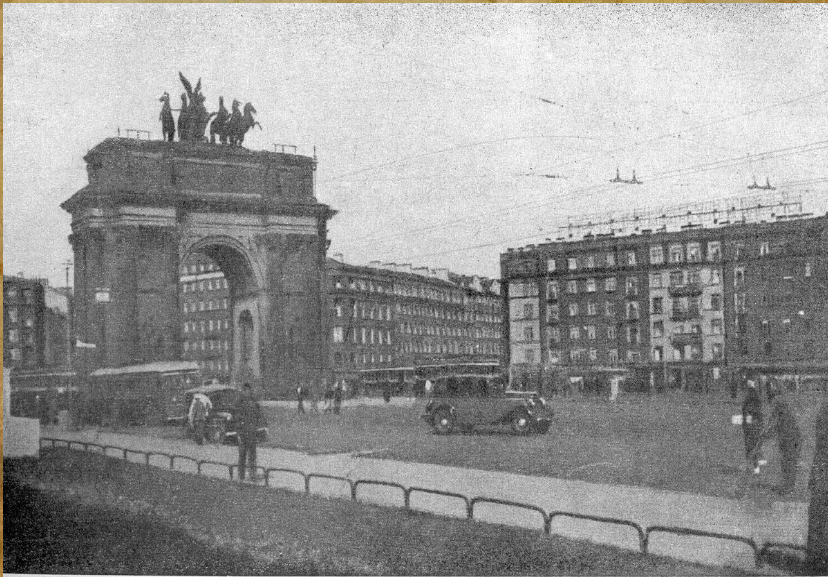
РАЙОН НАРВСКИХ ВОРОТ В 1935 ГОДУ ПОСЛЕ РЕКОНСТРУКЦИИ ПЛОЩАДИ.