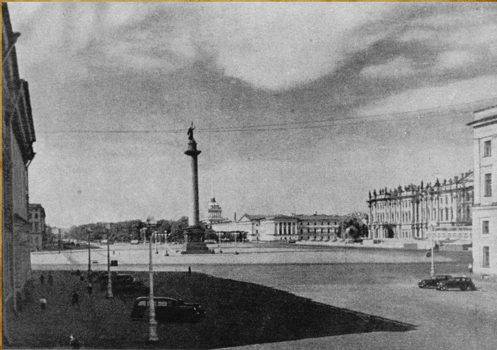
ОБЩИЙ ВИД ДВОРЦОВОЙ ПЛОЩАДИ СО СТОРОНЫ ПЕВЧЕСКОГО МОСТА.