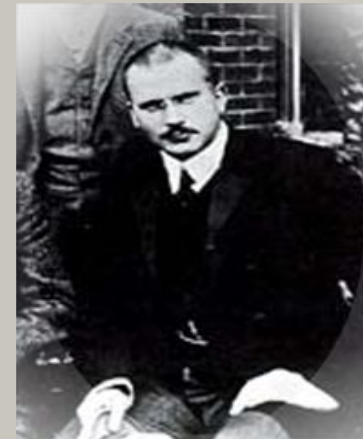
КАРЛ ГУСТАВ ЮНГ