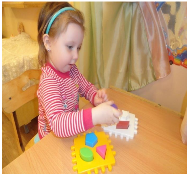
2. «Коробка форм»