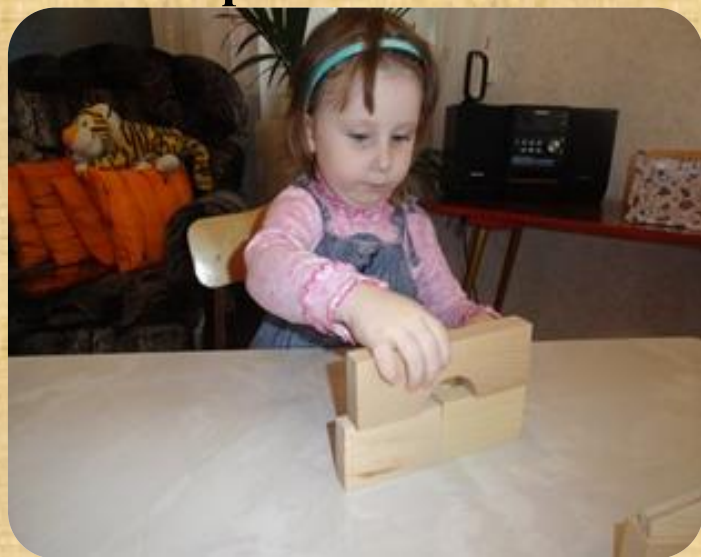
8. «Построй из кубиков»