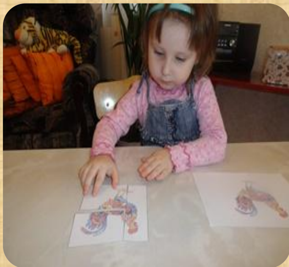
5. «Разрезные картинки»