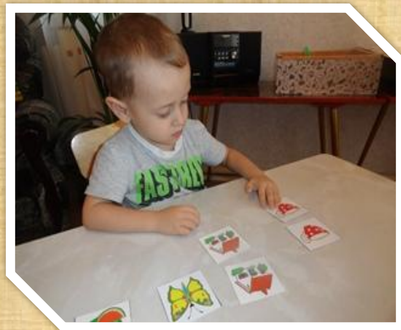
5. «Парные картинки»