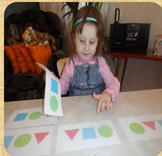
7. Найди пару