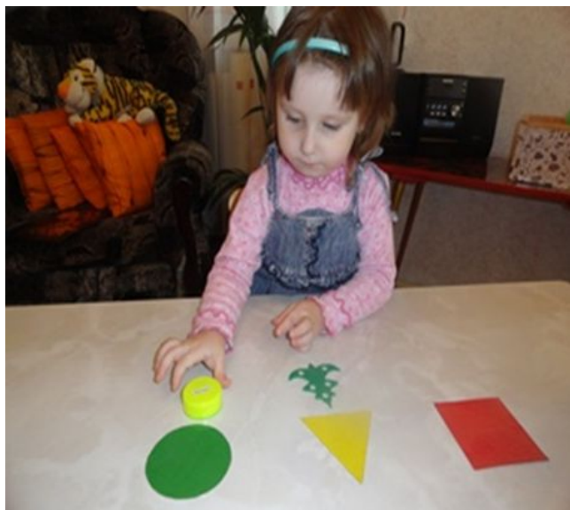
4. «Группировка игрушек»