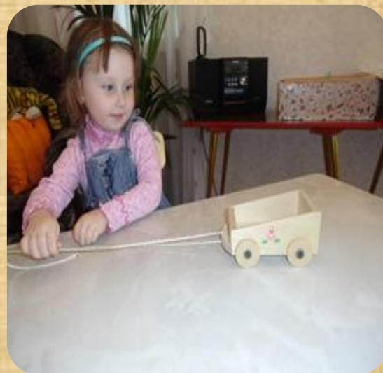
6. «Достань тележку»