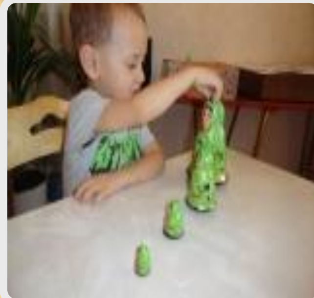
2. «Разбери и сложи матрешку»