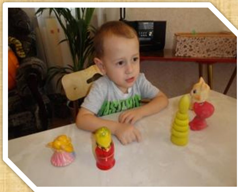
6. «Угадай, чего не стало?»