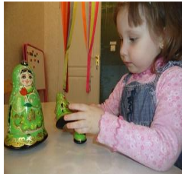
3. «Разбери и сложи матрешку»