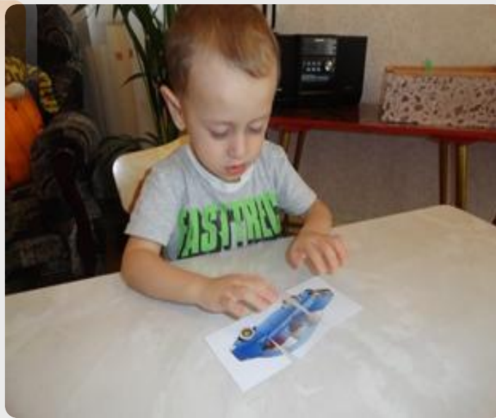
3. «Разрезные картинки»