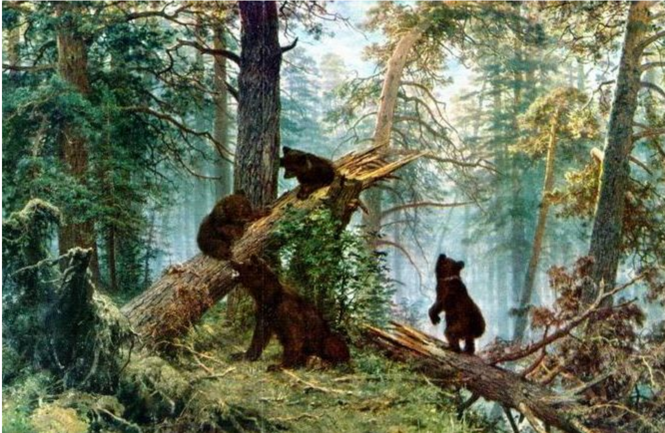
Шишкин «Утро в сосновом лесу»

«...природа вечный образец искусства...» В.В. Белинский