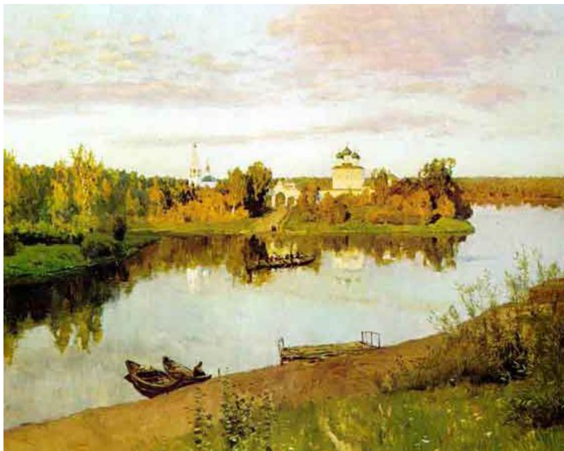
И. Левитан. «Вечерний звон».