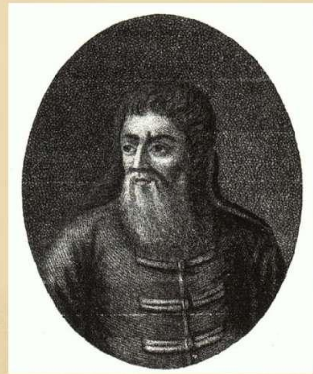
Никита Моисеевич Зотов

Первым учителем и наставником Петра 1 был дьяк Никита Моисеевич Зотов. Он научил молодого Петра читать и писать.