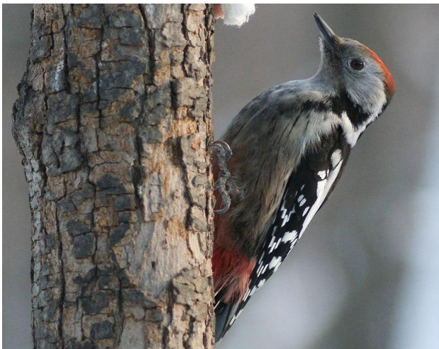
большой пестрый дятел