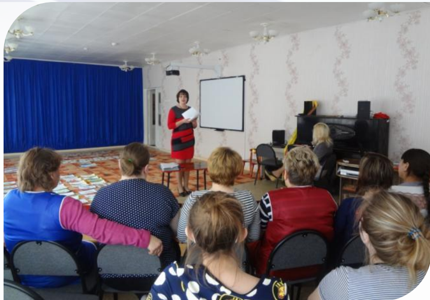
Проведение отчетно – выборного собрания