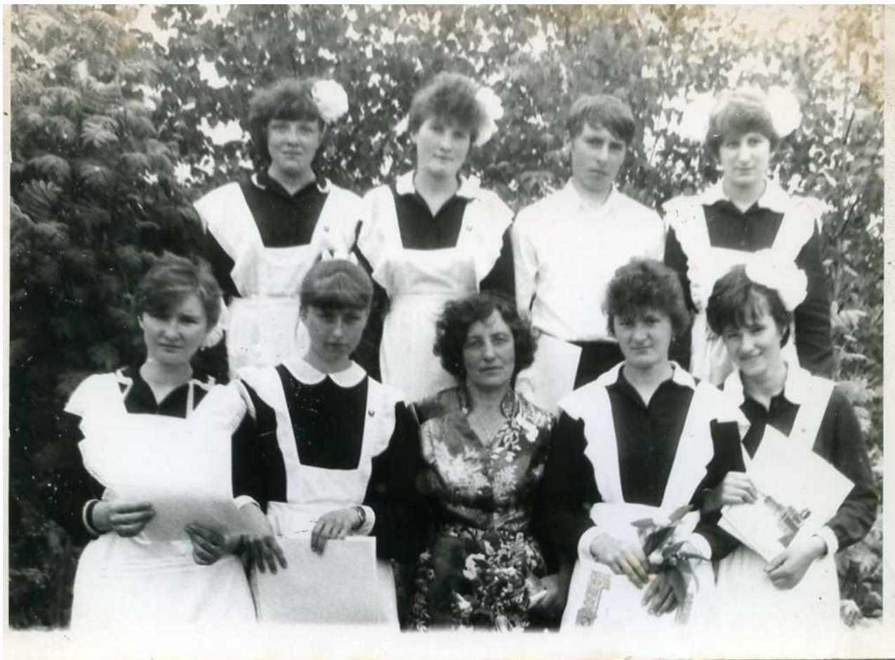
Участники кружка «Следопыт» (1987г)