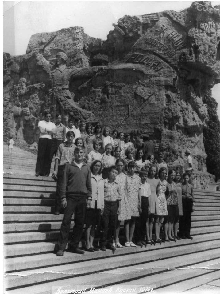
Экскурсия в город - герой Волгоград ( 1980 г )

Впервые в районе организовала школьный лагерь труда и отдыха «Юность»