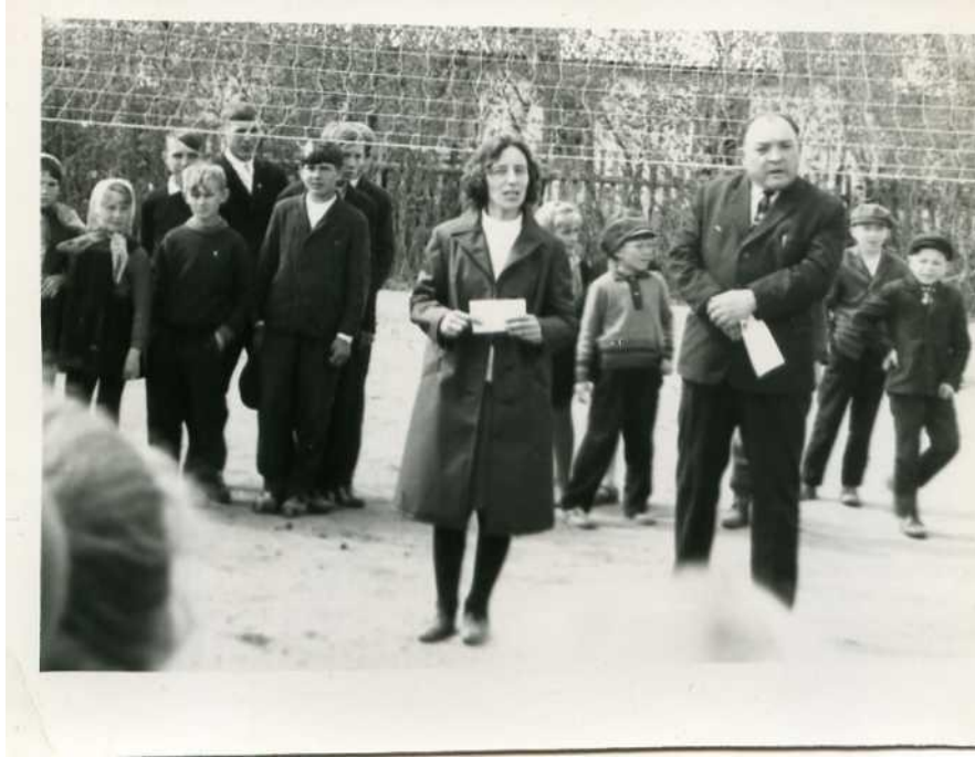
1973 г – общешкольная линейка

10 лет работала организатором внешкольной и внеклассной работы.