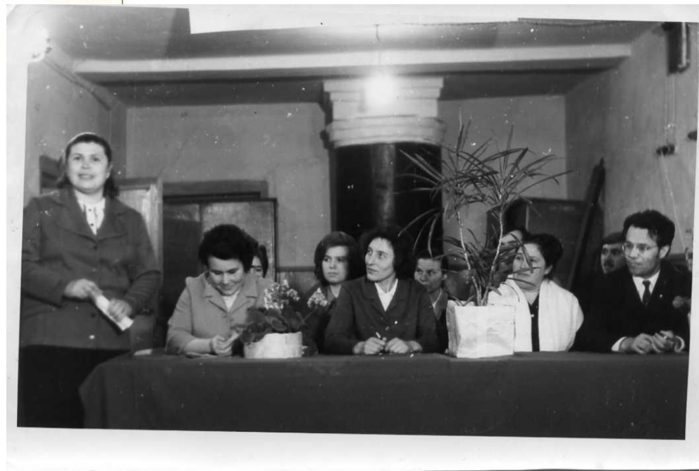
Два года проработала в должности директора школы