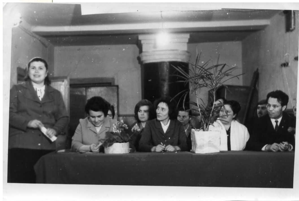
Два года проработала в должности директора школы