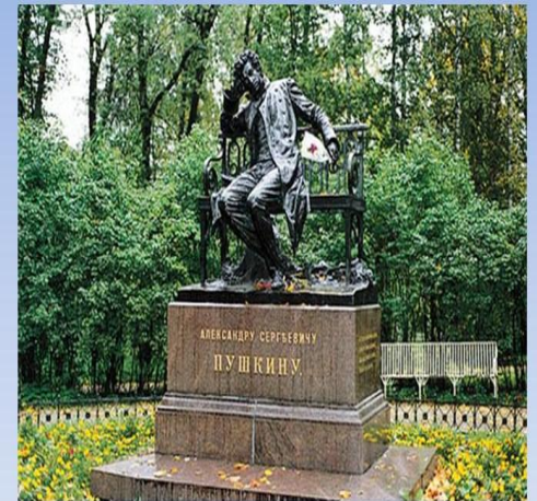
Памятник Пушкину - лицеисту в Царском селе. Скульптор Р. Бах

Работники культуры и искусства Пушкинского края бережно сохраняют историю и самобытные традиции, обеспечивают интересный досуг и занятость в разнообразных видах творчества жителей района. Среди 52 учреждений культуры – районные и городские Дома культуры, музыкальные и художественные школы, Пушкинский краеведческий музей, библиотеки. Район славится великолепным музеем-усадьбой «Мураново» им. Ф. И. Тютчева.