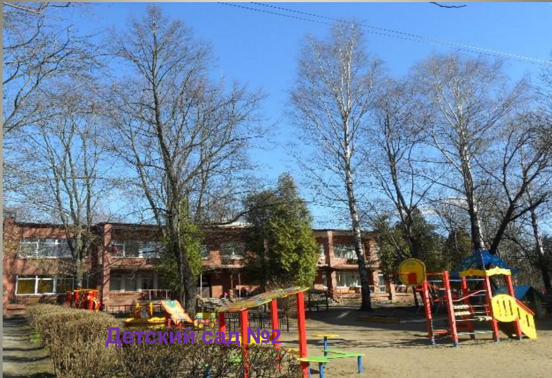
Детский сад №2