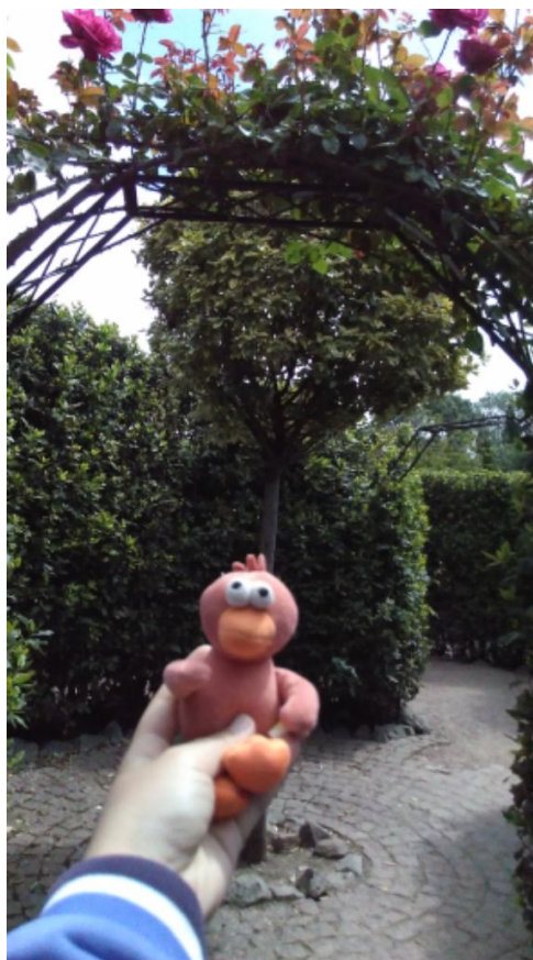
Утя в лабиринте