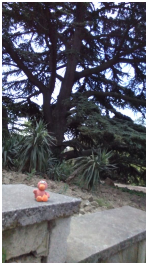
Утя и кедр