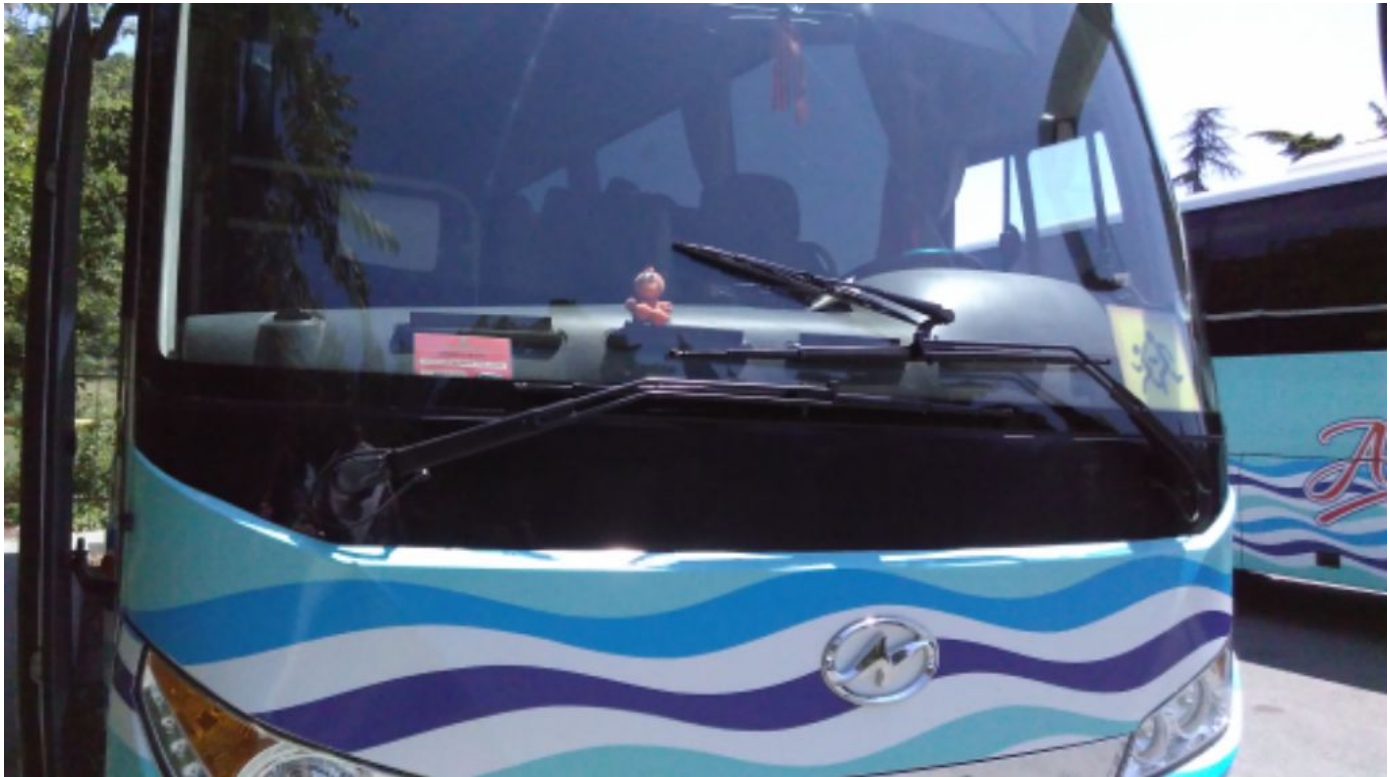
Посадка в автобус