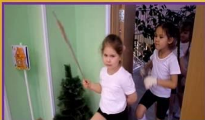
Спортивный досуг «Будущие олимпийцы»