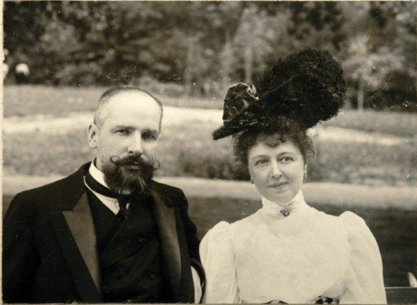
П. А. Столыпинъ — Министръ Внутреннихъ Дѣлъ, въ 1906 г., съ супругой.