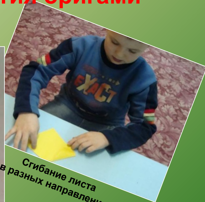
Сгибание листа в разных направлениях