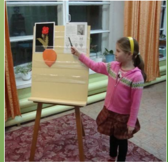
Работа со схемами