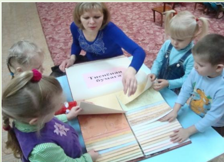
Рассматривание альбома «Сорта бумаги»