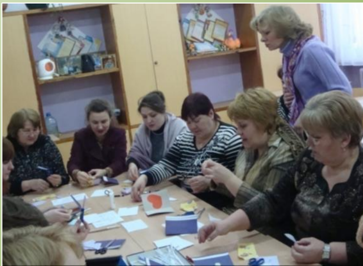
Изготовление «валентинки» в МОУ СОШ № 5