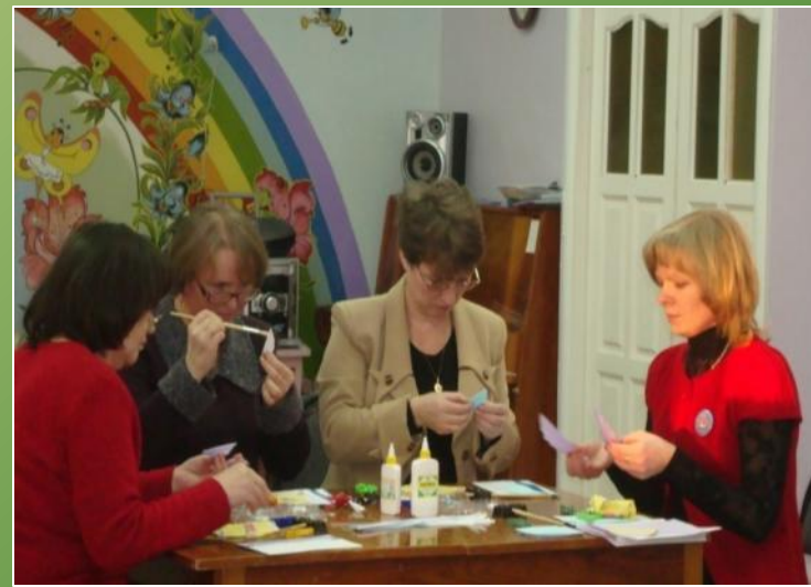
Мастер-класс «Новогодняя открытка» с коллегами города