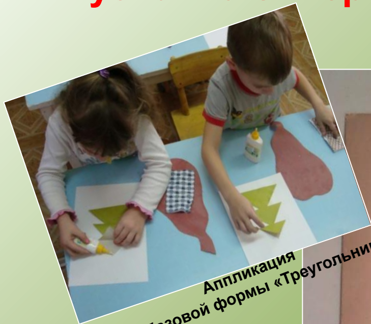
Аппликация из базовой формы «Треугольник»