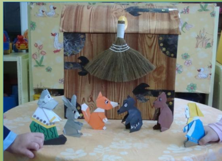
Кукольный театр оригами по сказке «Колобок»