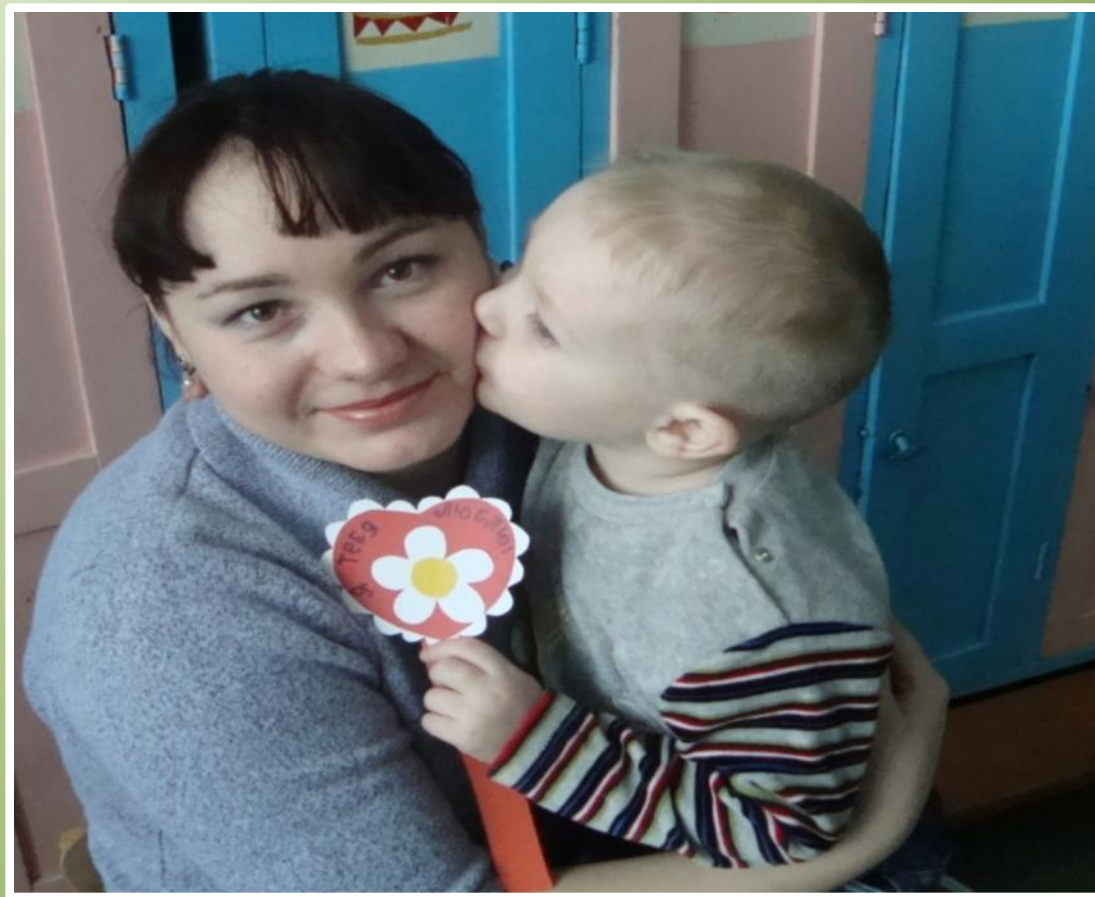
Подарок для мамы