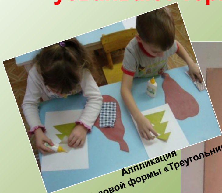
Аппликация из базовой формы «Треугольник»