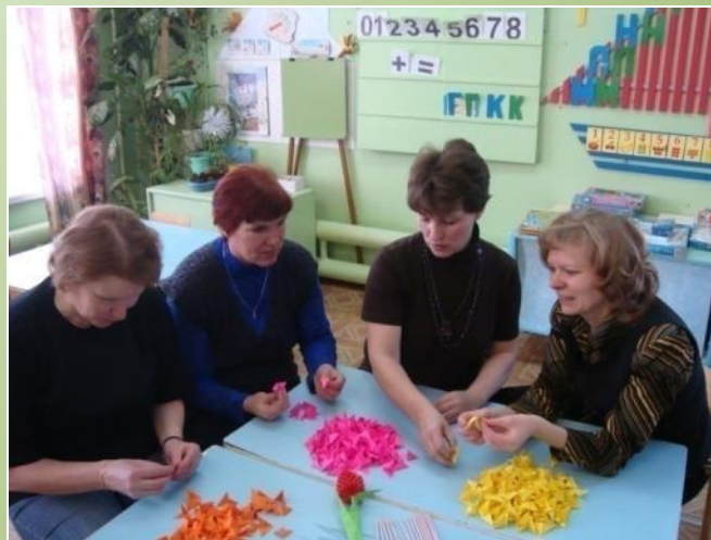
Мастер-класс в ДОУ по изготовлению цветка «Тюльпан»