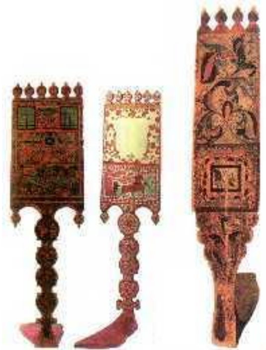
Прялки конец XIX века Архангельская губерния