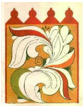
Ракульская роспись. Фрагменты росписи прялок.