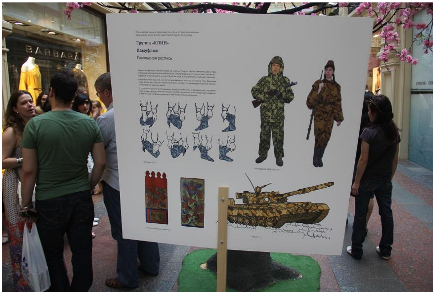
"Фонд "Открытая коллекция" основан летом 2010 года. Цель фонда - сохранение, возрождение и популяризация забытых росписей народов русского Севера.