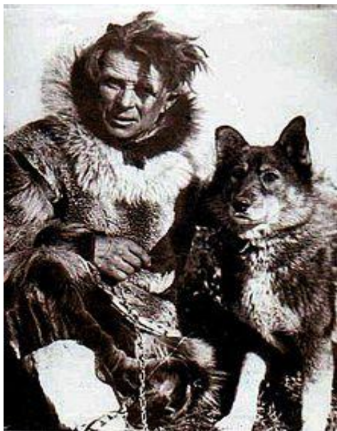
Леонард Сеппала с хаски Того

Описание этой породы собак говорит о том, что эти животные впервые появились у чукчей . Было время, когда этому полукочевому племени нужно было расширить охотничьи территории, а для этого нужна была собака , способная быстро передвигаться на большие расстояния и перевозить груз от мест промысловой охоты к постоянным поселениям и обратно. Небольшой размер собак чукчи компенсировали большим размером типичной упряжки, насчитывающей 15—17 собак.