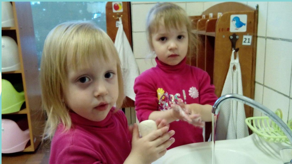
Формирование культурно-гигиенических навыков