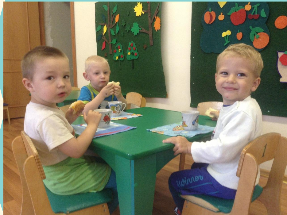
Формирование навыков самообслуживания