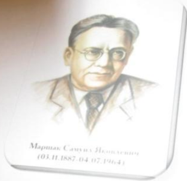
Маршак Самуил Яковлевич (03.11.1887-04.07.1964)

«ПУСКАЙ - БЕДА НАМ ТЯЖЕЛА, НО В НЕЙ ТЫ УЗНАЁШЬ, КАК ОТЛИЧИТЬ ДОБРО ОТ ЗЛА, ГДЕ - ПРАВДА И ГДЕ ЛОЖЬ».