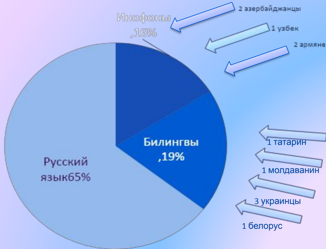
Распределение учащихся по группам