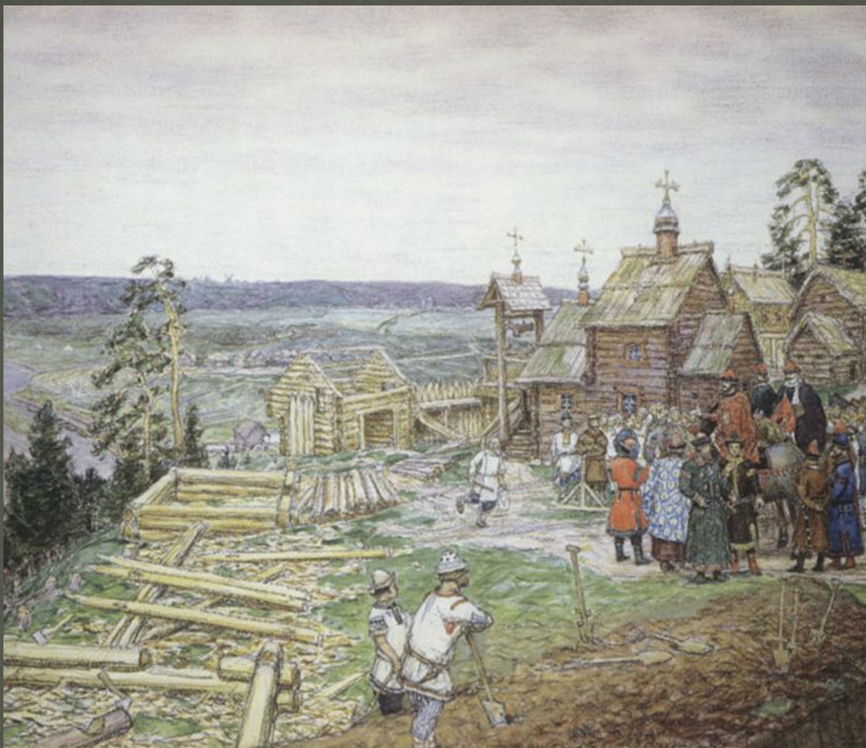
А. ВАСНЕЦОВ Основание Москвы