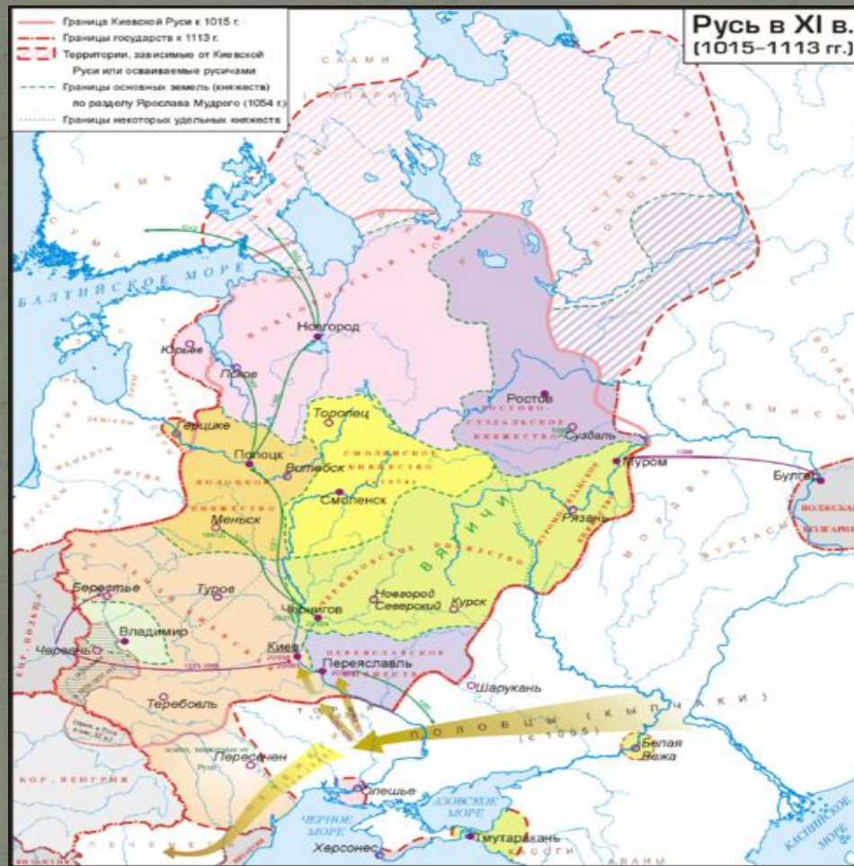
Киевская Русь в XI — нач. XII веках