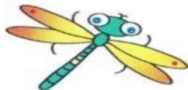
стрекоза стрекочет тр-тр-тр