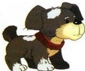
собака гавкает гав-гав