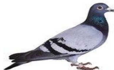
голубь воркует гуль-гуль