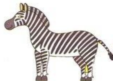
зебра ржёт иго-го