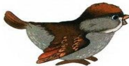
воробей чирикает чир-чир