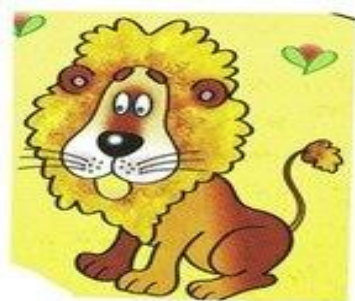
лев рычит р-р-р