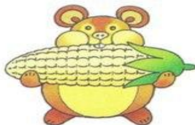
хомяк хрустит хрум-хрум