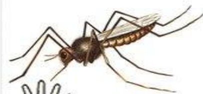
Дети в комары кусит пили