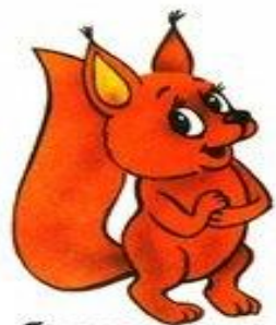
белка цокает цок-цок