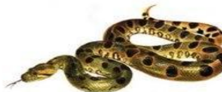
змея шипит ш-ш-ш