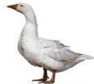
гусь гогочет га-га-га