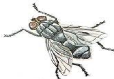
муха жужжит ж-ж-ж-ж