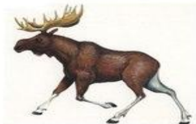
лось трубит у-у-у-у-у