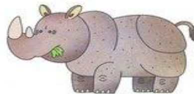
носорог фыркает фыр-фыр