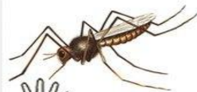
Дети в комары кусит пилиги