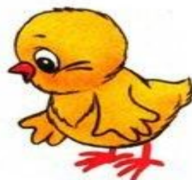
цыплёнок пищит пи-пи-пи