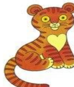
тигр рычит р-р-р-р-р