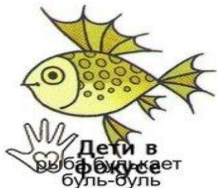
Дети в рыба фыркает буль-буль