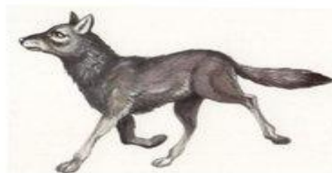
волк воет у-у-у-у-у