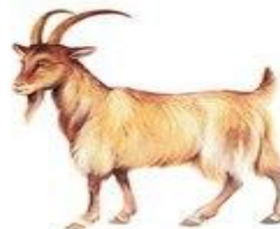
коза мекает ме-ме-ме