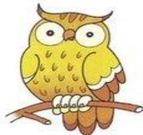
сова ухает ух-ух