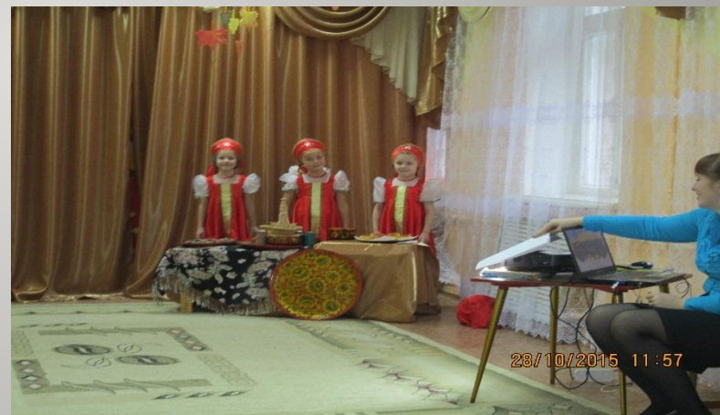
Праздник осени «Ярмарка» в разгаре