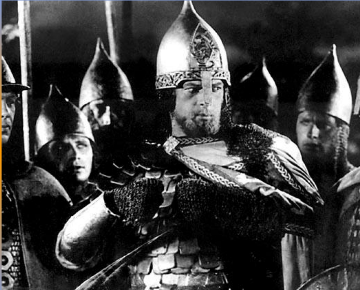
Кадр из фильма С.Эйзенштейна