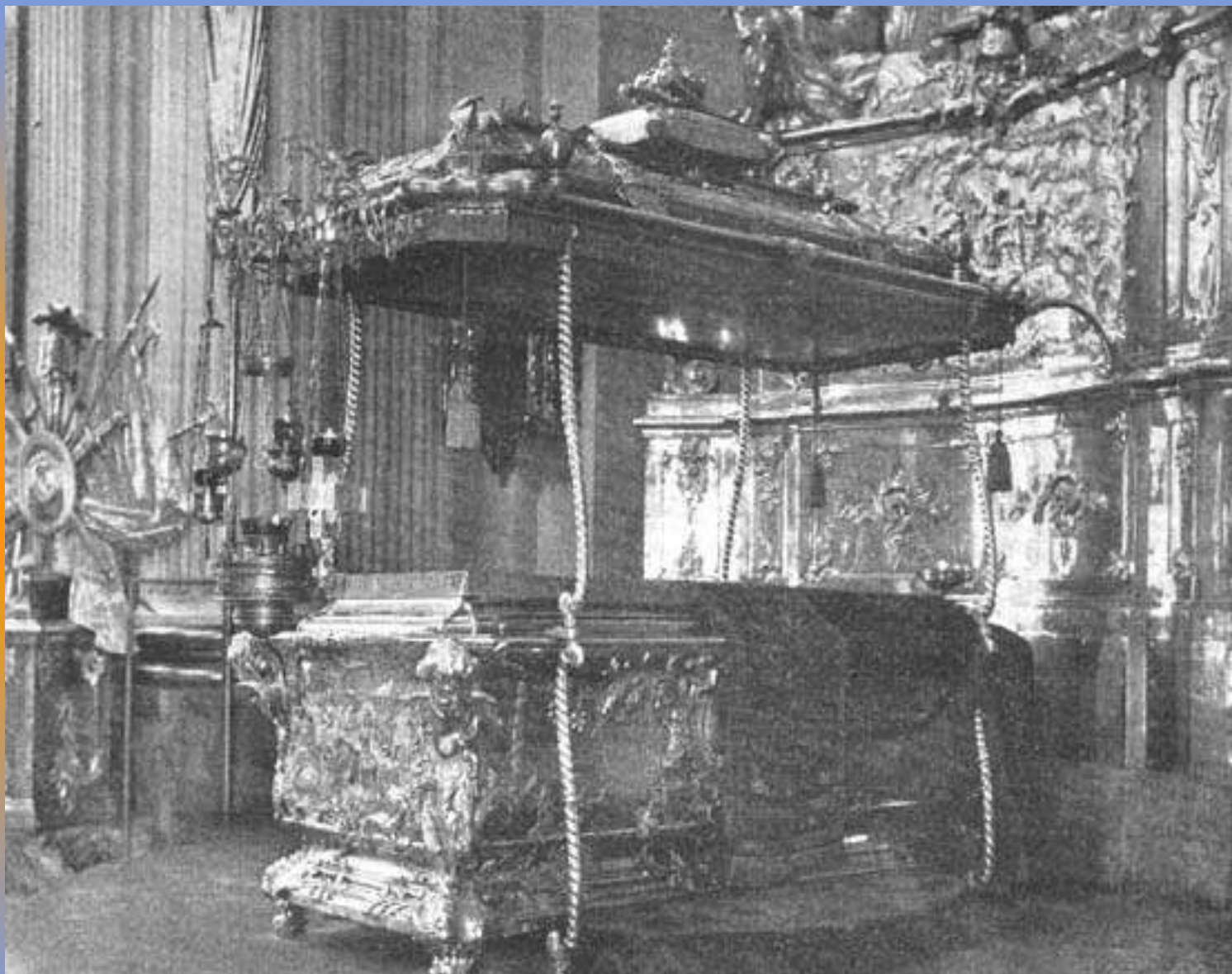
Мощи Александра Невского