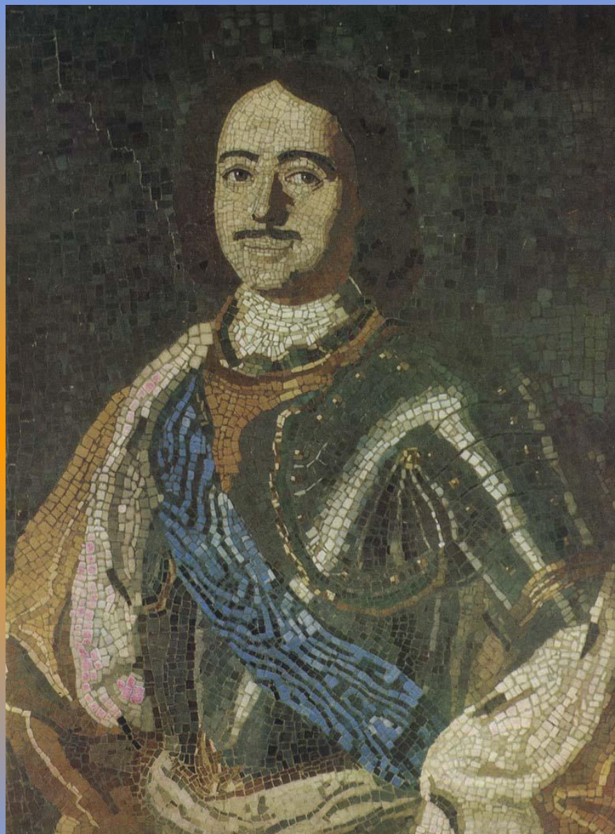
Царь Петр I