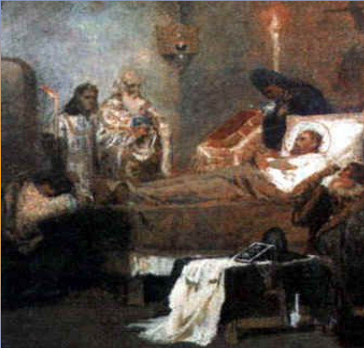
Отпевание Александра Невского