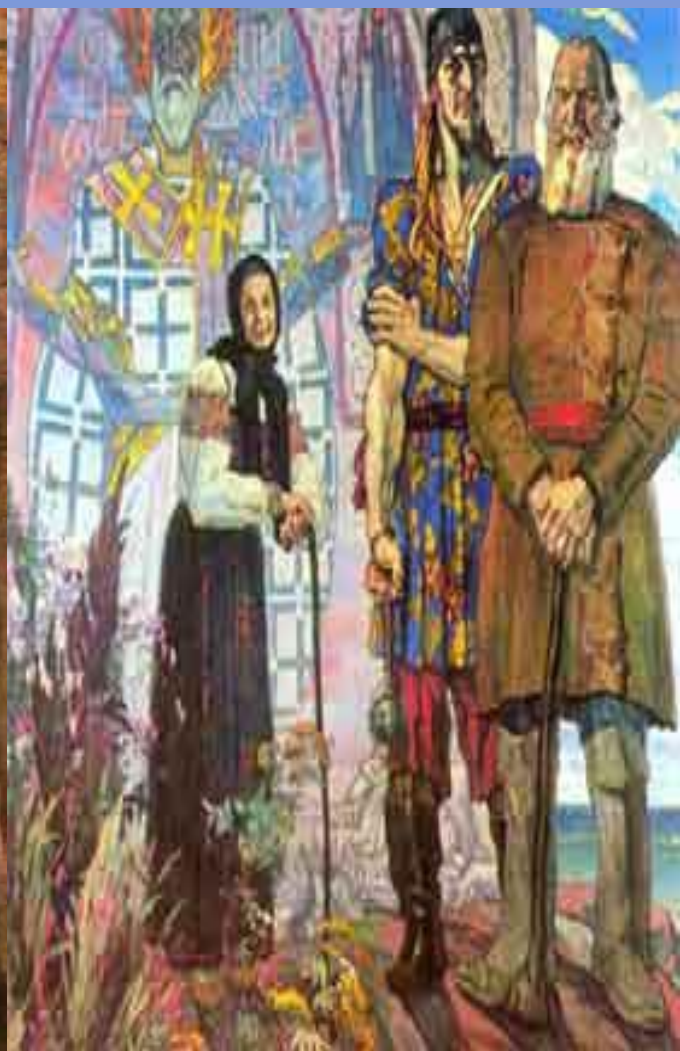
П.Корин. Триптих «Александр Невский»