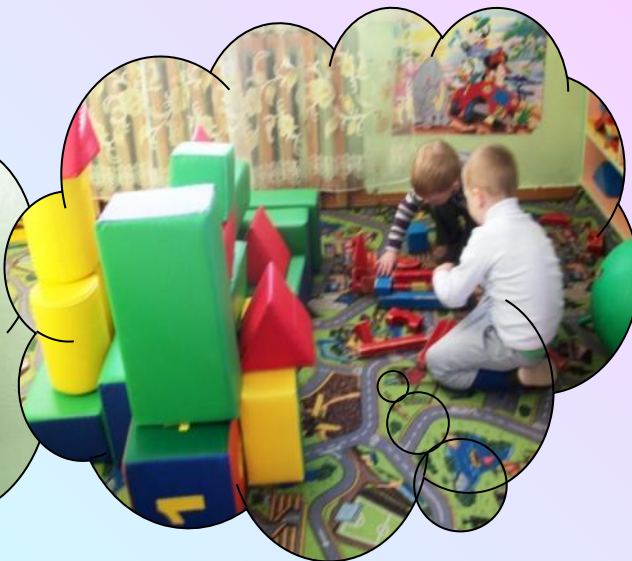
Разноцветные игровые зоны