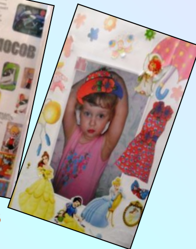
Метки для шкафчиков