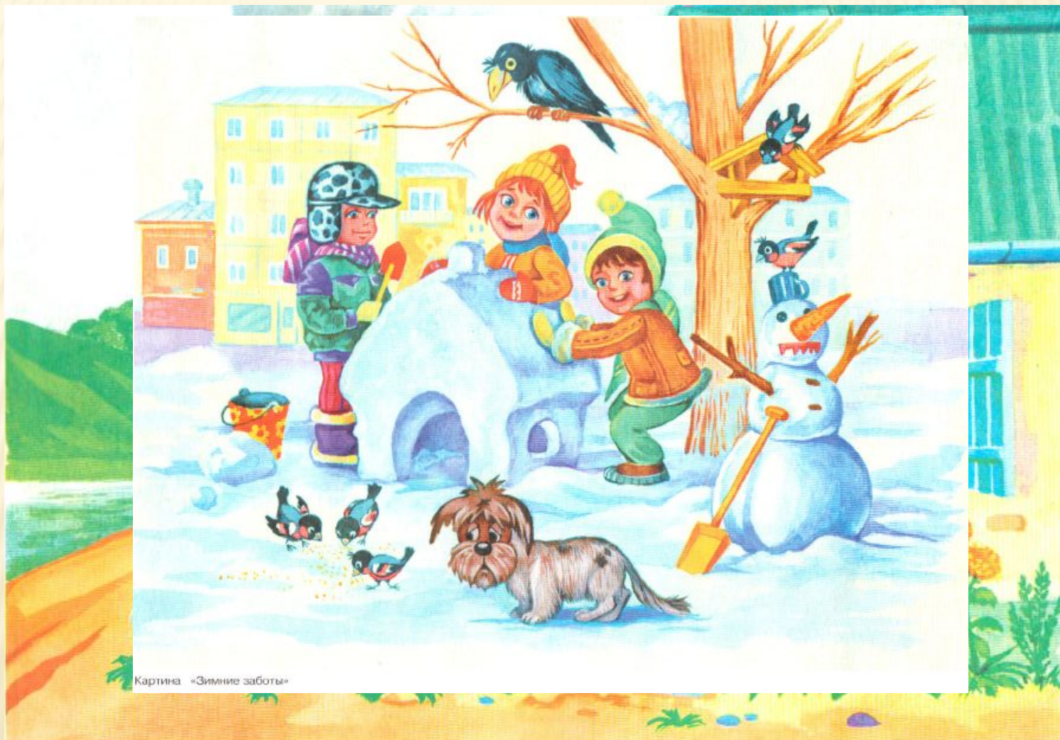
Картина «Зимние заботы»