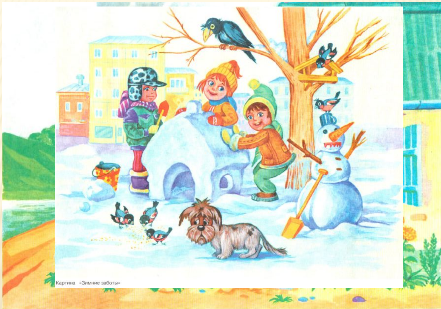
Картина «Зимние заботы»