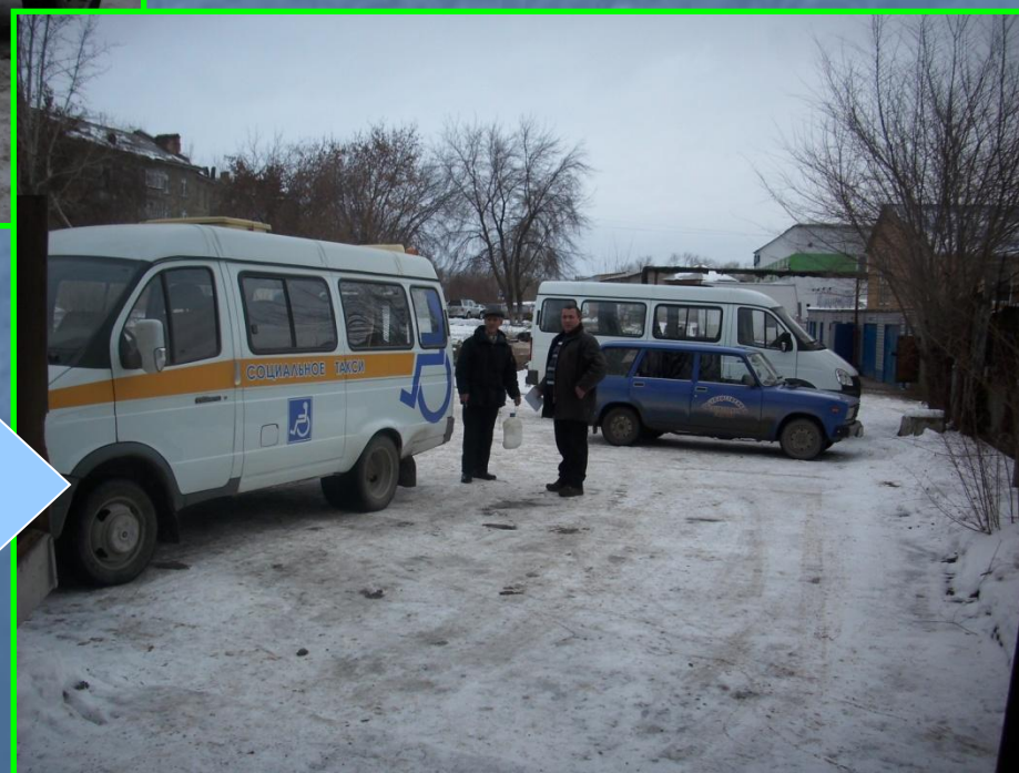
Газель с гидроподъемником для перевозки инвалидов - колясочников