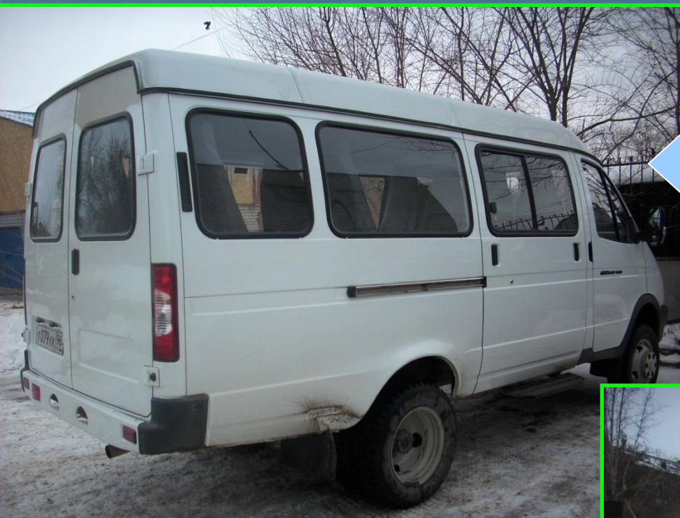
Пассажирская газель на 13 мест