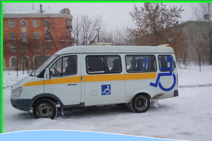
Работа службы «Социальное такси»