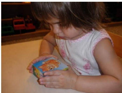
Кубики с картинками.