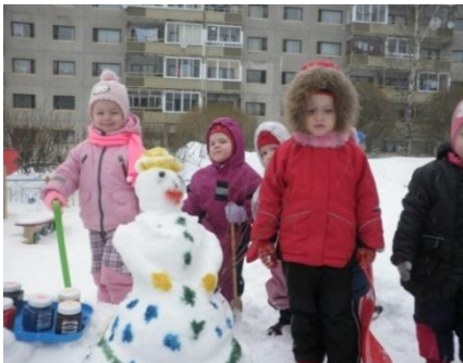
Мы катаем снежный ком...