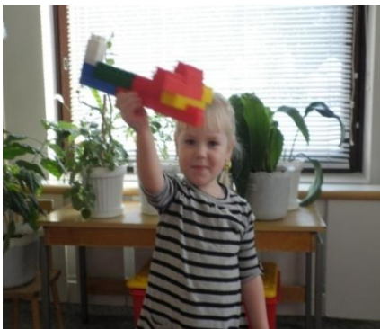
Самолет построим сами...