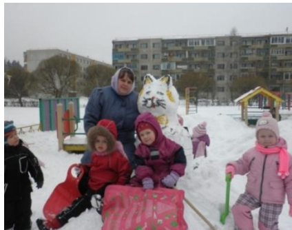
Как у нашего кота, Шубка очень хороша...