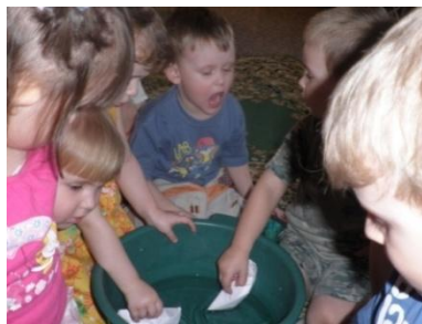
Конструирование корабика из бумаги.