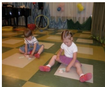
Составление кораблика из трех частей.