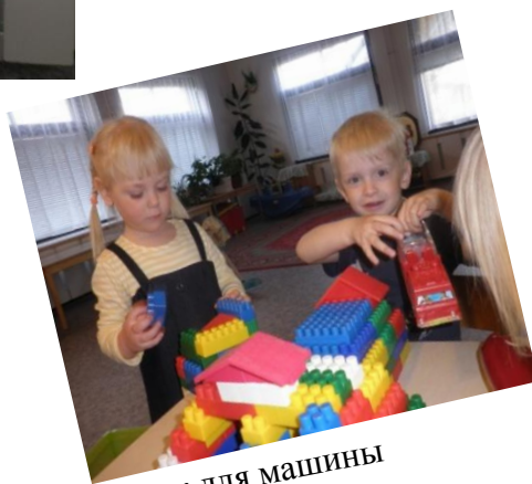
Гараж для машины