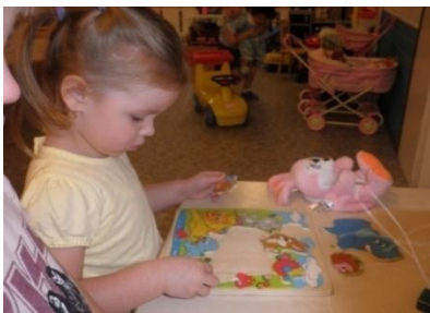
Собери целое из частей.