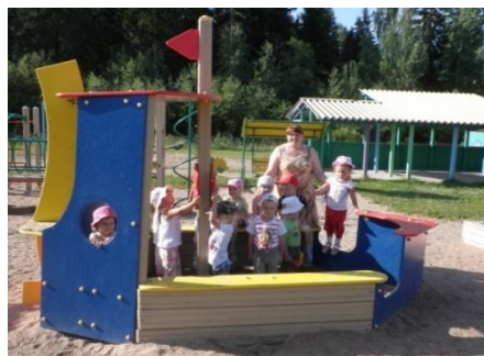
По морям, по волнам...