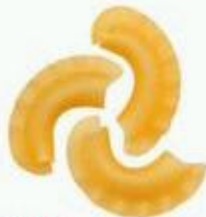
РОЖКИ с гребешком