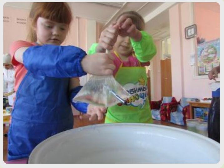
ДЫРКА В ПАКЕТЕ – НЕ БЕДА