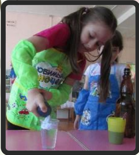
ДОЖДЬ ИЗ ТУЧКИ