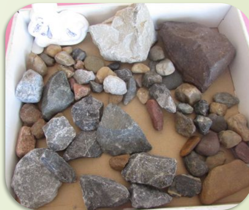
«Удивительный мир камней»