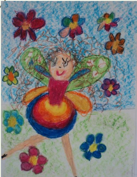
Шутова Валерия, 5 лет