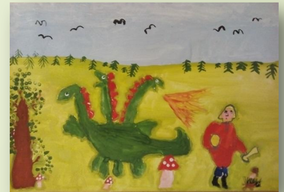
Кирилл Пикалов, 6 лет