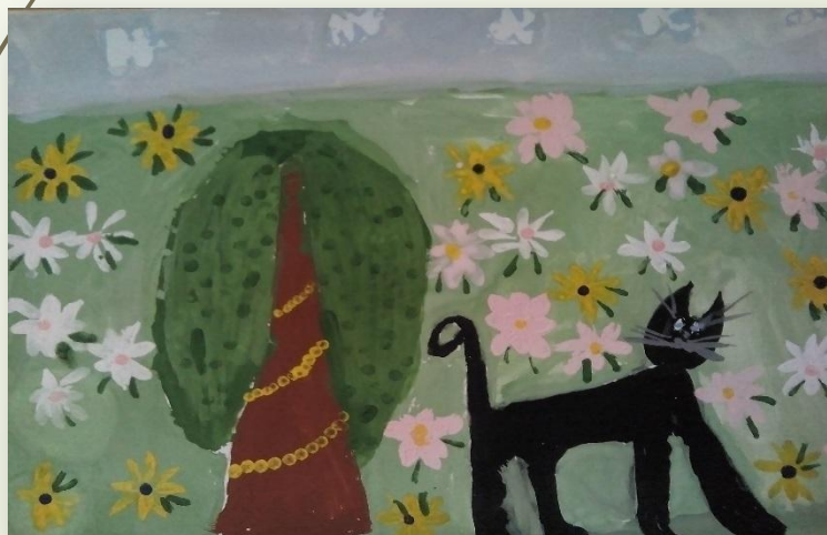
Дарья Литвиненко, 6 лет