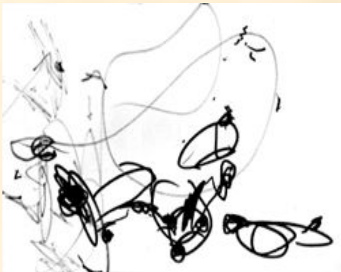
Рис. 1. Катя, 1 г. 9 мес.

Дети очень любят рисовать. Как только маленькая ручка становится способной ухватить карандаш, сразу же у ребенка появляется стремление что-то изобразить на листе.