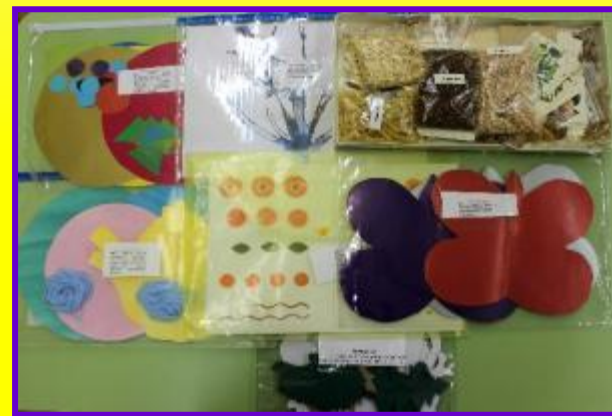
Подбор и изготовление дидактических игр