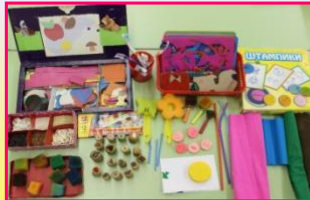
Подбор нетрадиционного материала для рисования и аппликации