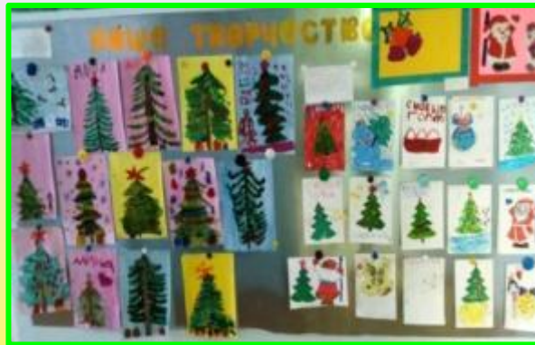
Оформление художественной выставки