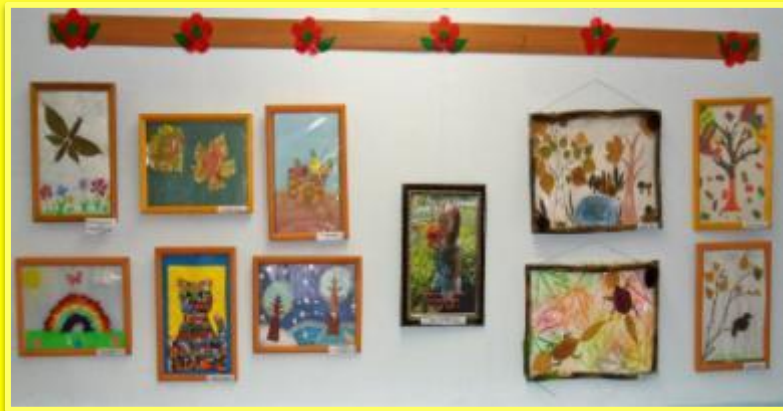
Оформление персональной выставки