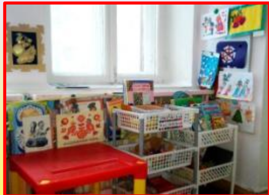
Оформление Центра творчества