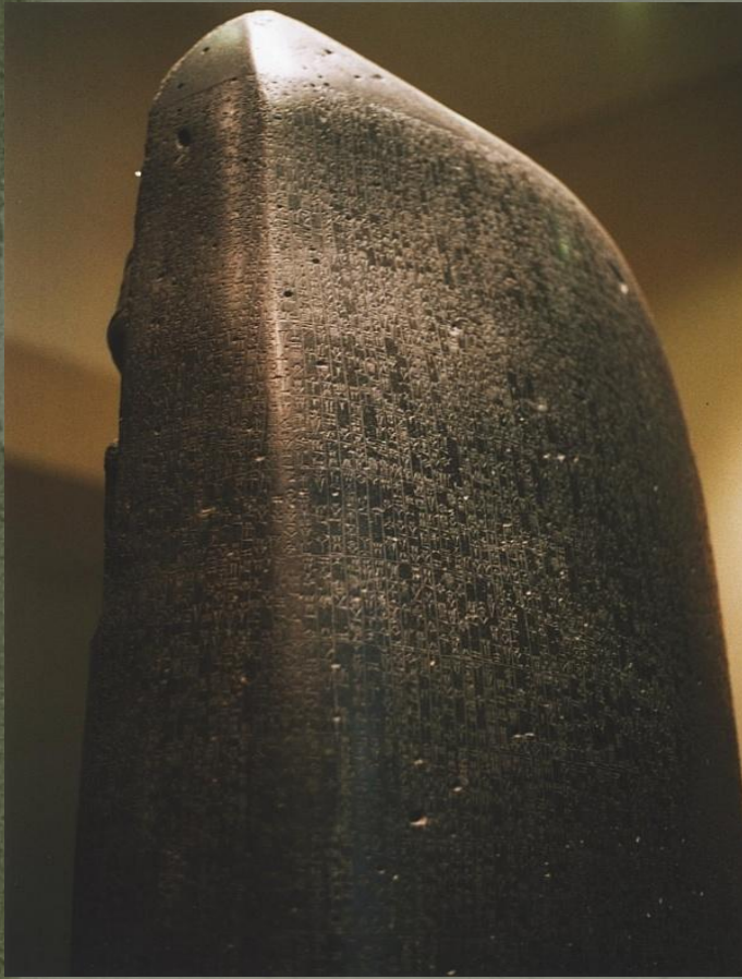
Стела с законами Хаммурапи