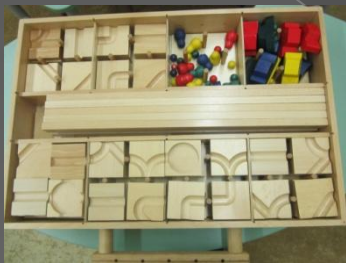
Пространство и преобразование