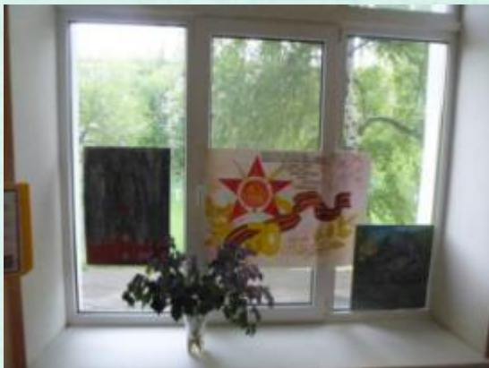
Акция «Птичий дом»

«Ни что не забыто, никто не забыт!» - акция ко Дню Победы