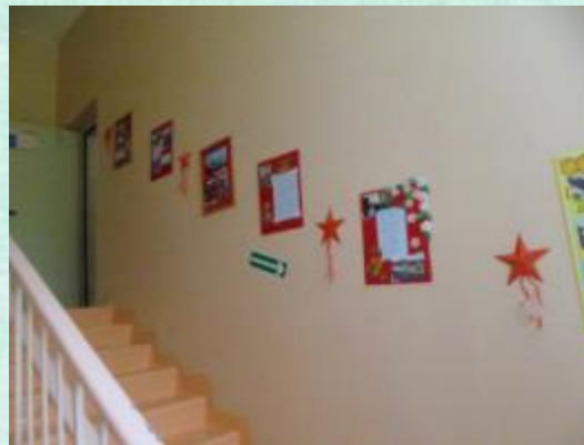
Акция «Сталинградские окна»