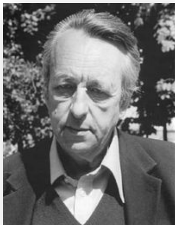
Луи Пьер Альтюссер