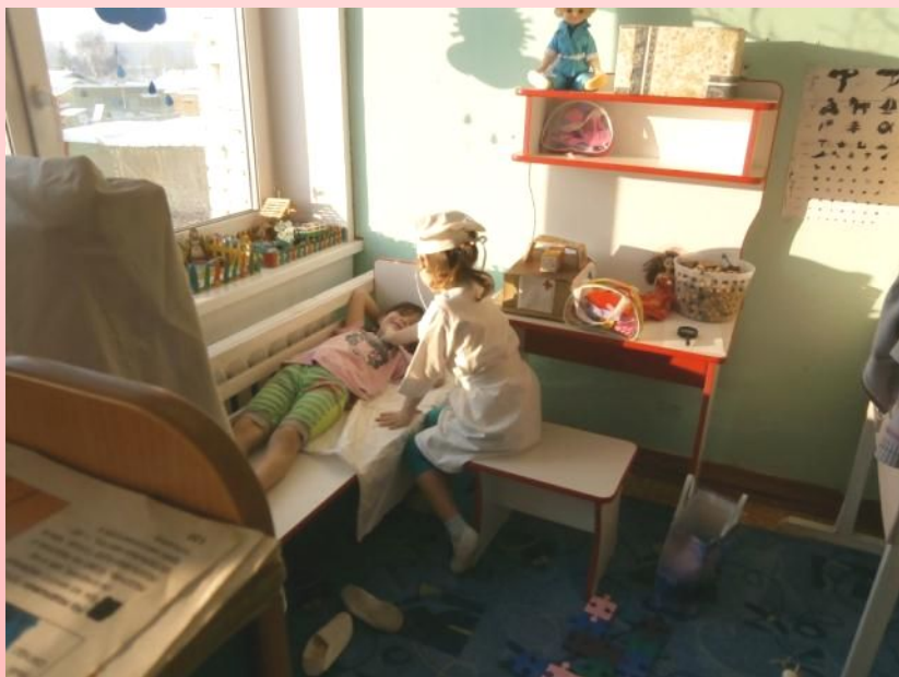
Сюжетно ролевая игра «Больница»