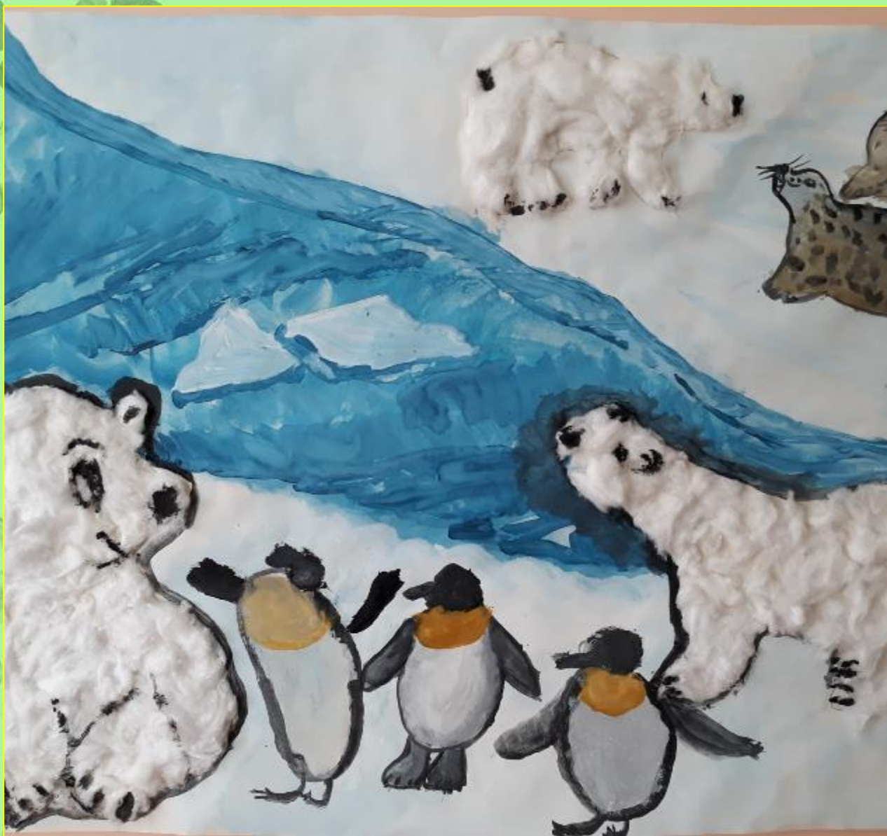
«Звери на льдине»- коллективная работа ребят