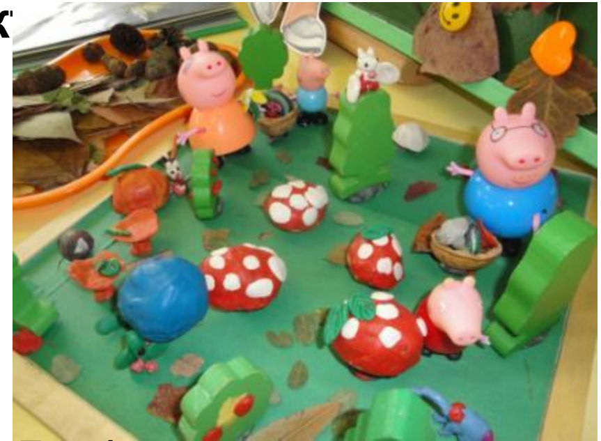
«Грибная полянка» (11.09.2017 г.)

Тема недели «Краски и дары осени» (09.2017 г.)