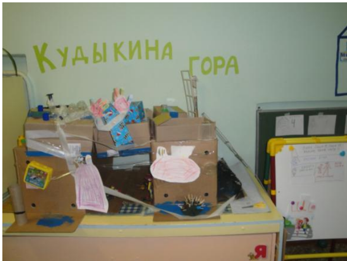
«Кудыкина гора» (02.2017 г.)