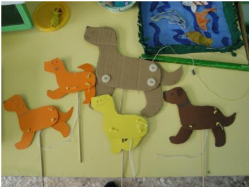
Игрушки сделанные своими руками (09.-10.2017г.)