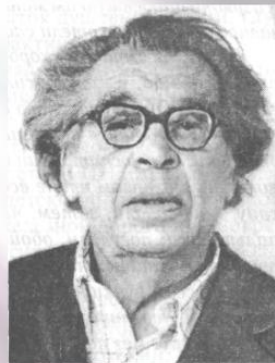
Даниил Борисович Эльконин (1904—1984) советский психолог, автор оригинального направления в детской и педагогической психологии.