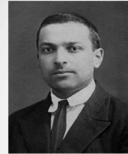
Выготский Лев Семенович