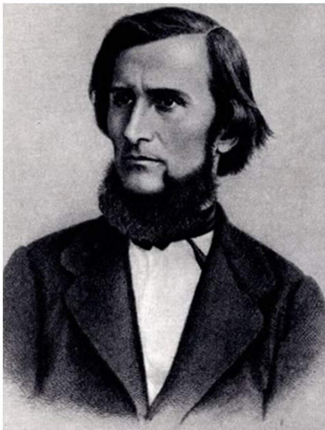
Константин Дмитриевич Ушинский (1824 – 1870)