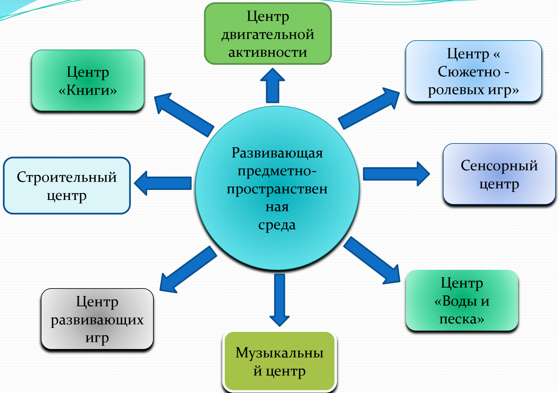
СХЕМА ГРУППОВОЙ СРЕДЫ