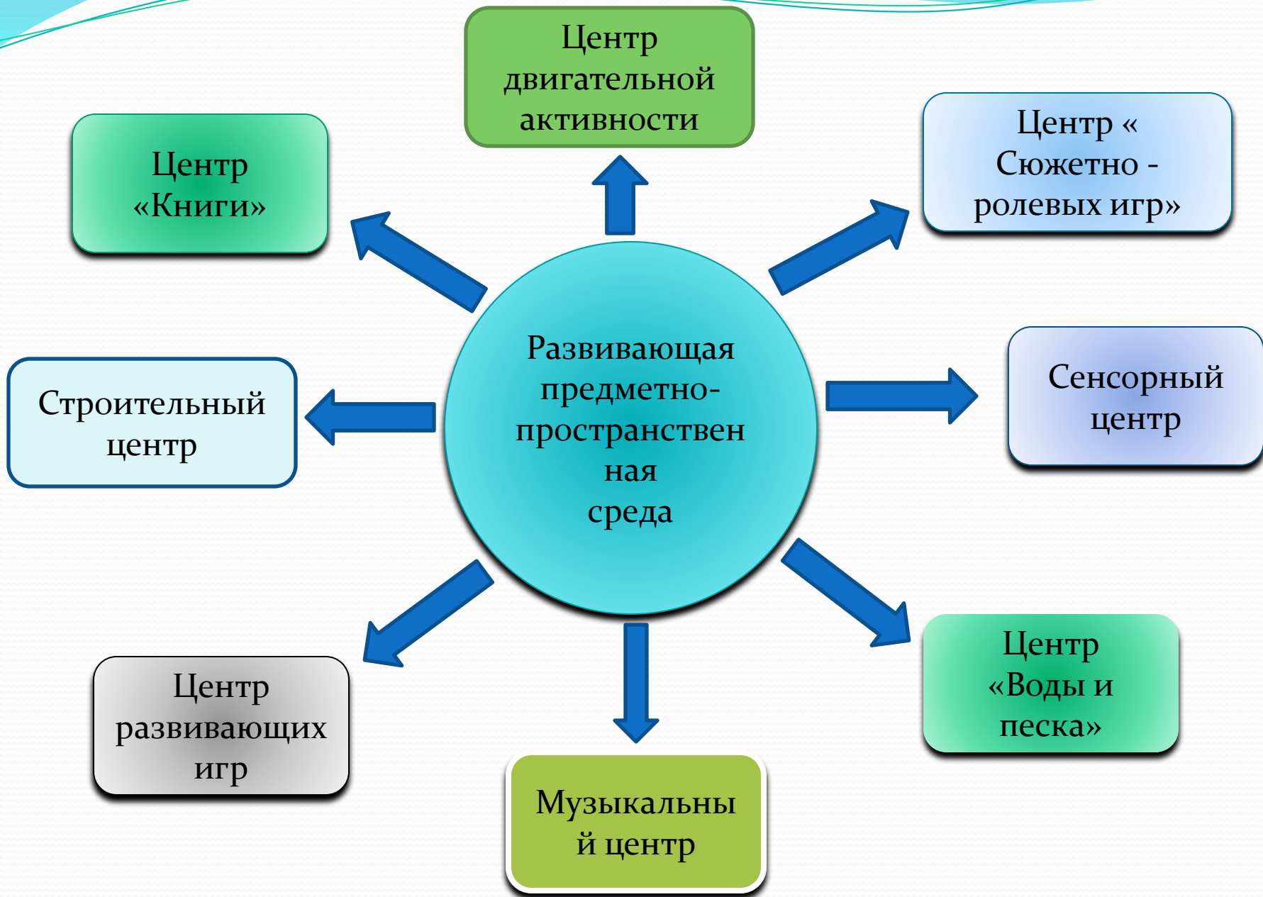
СХЕМА ГРУППОВОЙ СРЕДЫ