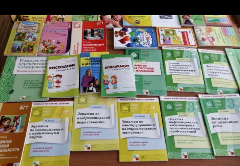
1.6. Рабочий сектор (методическая литература педагога)