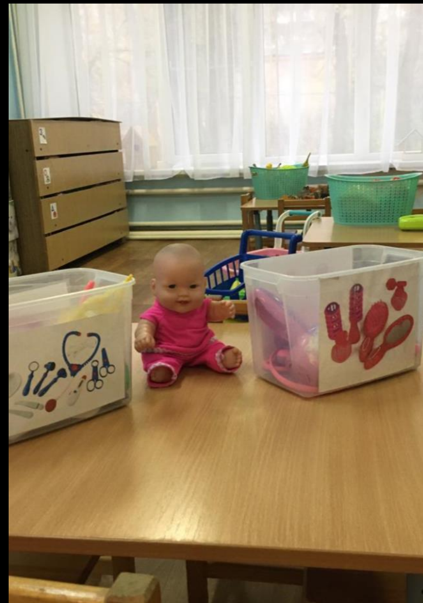
2.2.5. Активный сектор