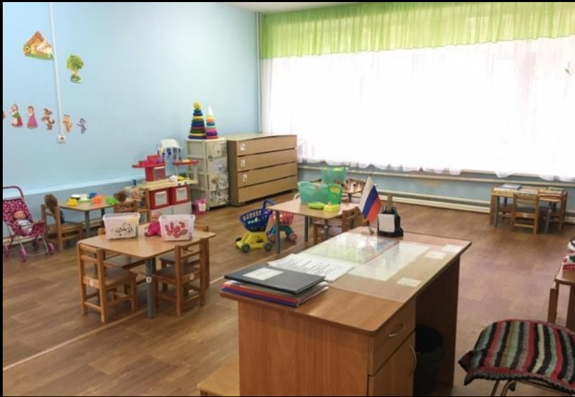
Верхняя левая точка