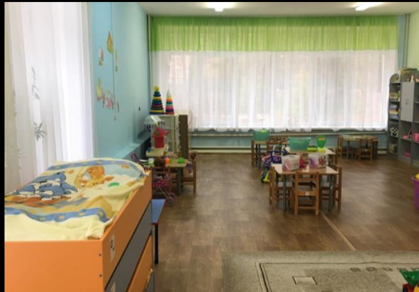
Нижняя правая точка