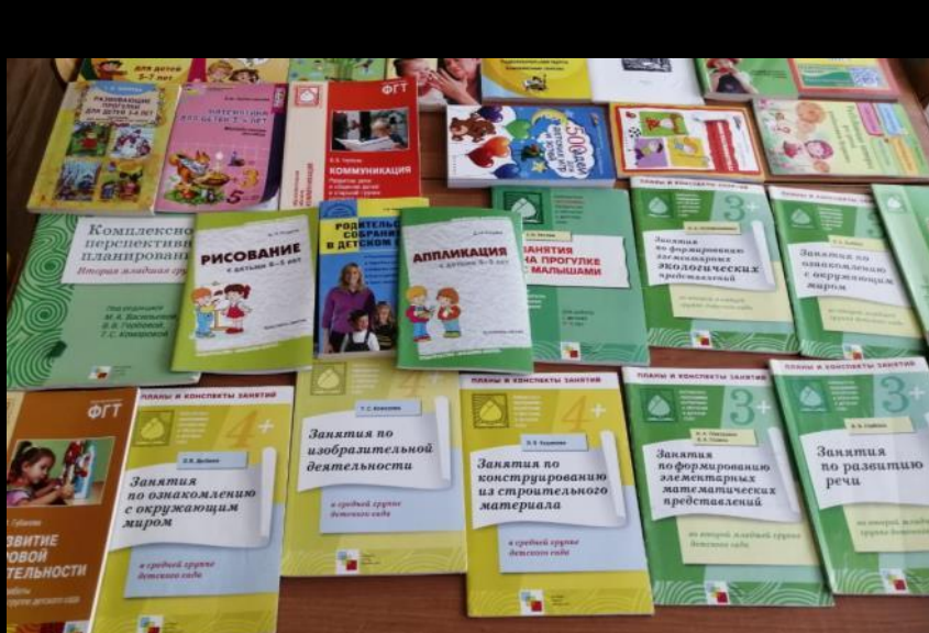
1.6. Рабочий сектор (методическая литература педагога)