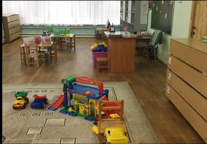
Верхняя правая точка