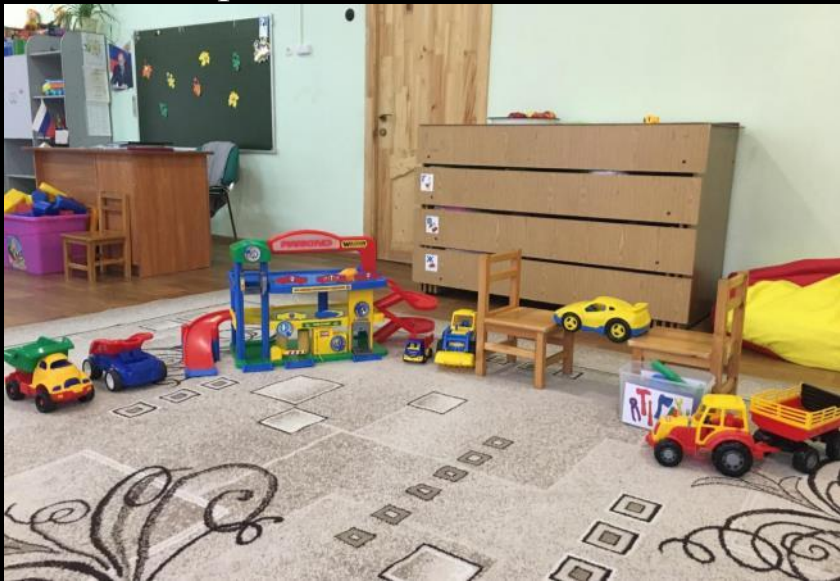
Вход в группу, нижняя левая точка