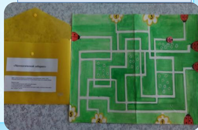
Д/и «Цифровой лабиринт»