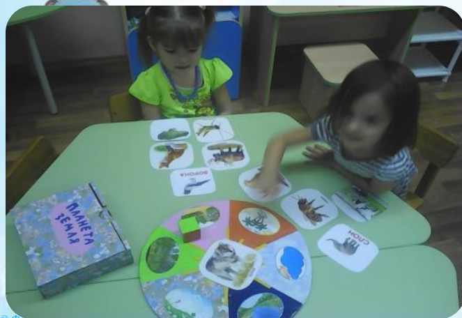
Д/и «Планета земля»