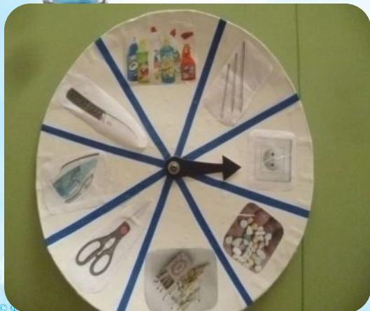
Д/и «Часы безопасности»