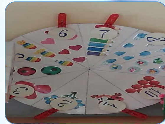
Д/и «Математические часы»