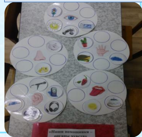
«Наши помощники – органы чувств»