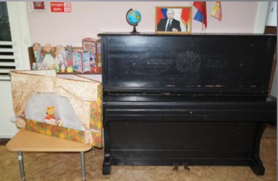
Мир звуков и музыки

Физическая активность. В центре находятся мячики для метания, кольца, атрибуты для подвижных игр, «дорожки здоровья», массажные коврики, погремушки, обручи.