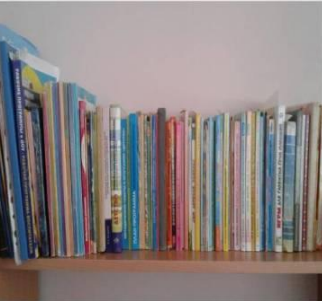
методическая литература педагога