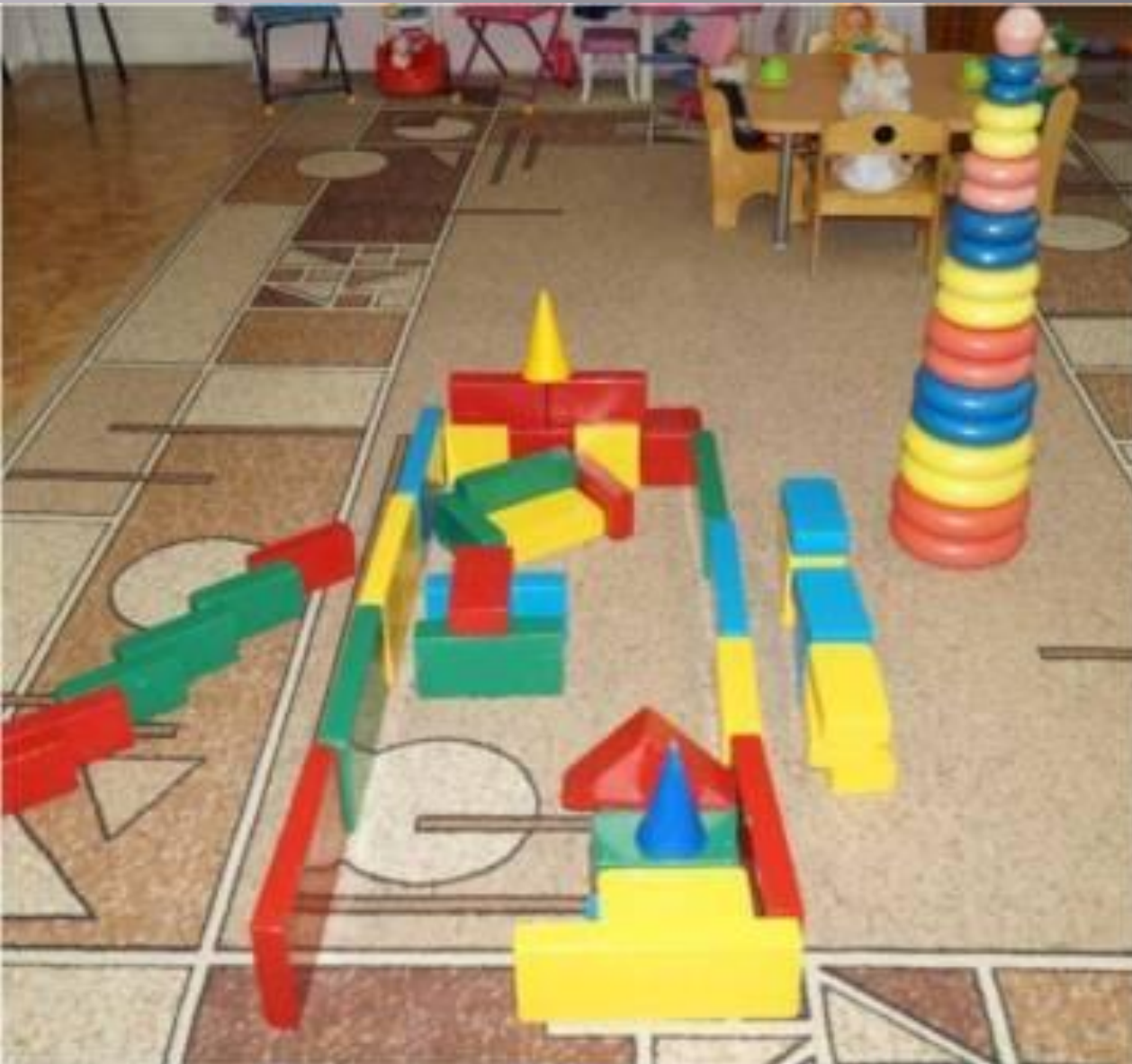
С/Р игра «Строители»