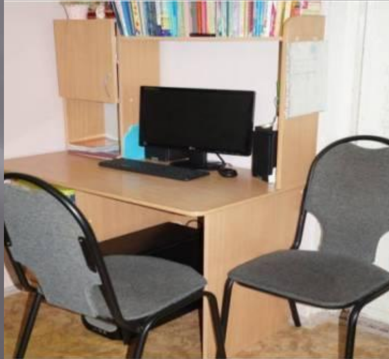
ИКТ для педагога