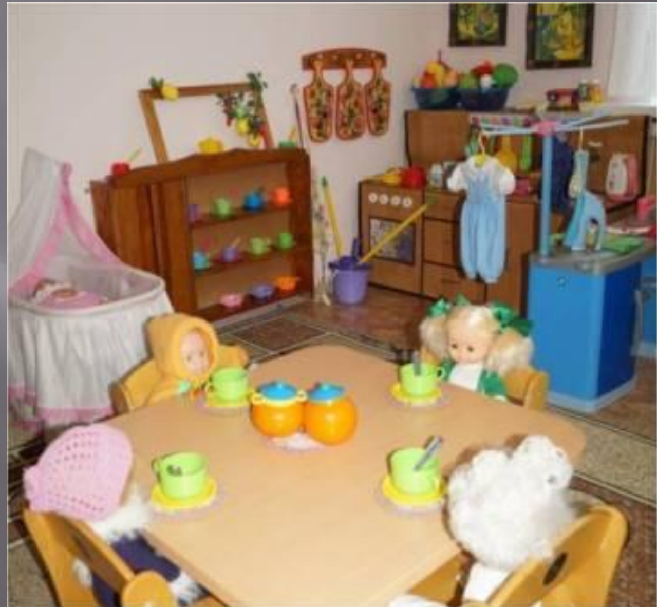
С/Р игра «Семья»