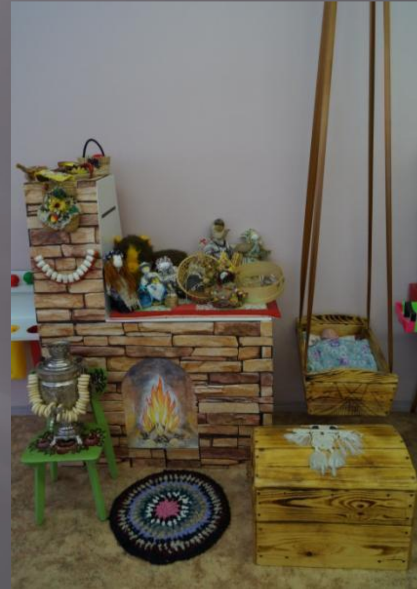
Освоение родного языка и литературы